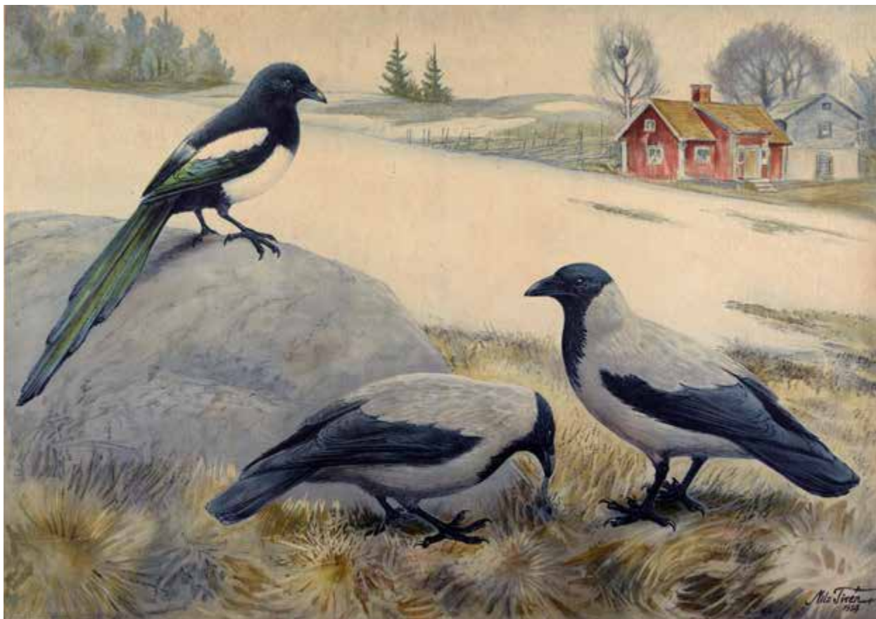
Svensk skoleplansje med skjære og kråker. Kunstner Nils Tiren 1928.