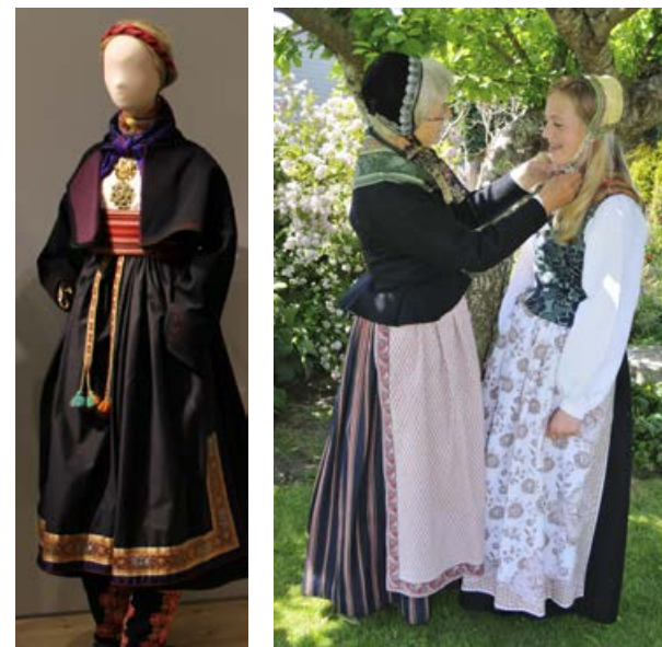
Til venstre: beltestakk frå Telemark. Modellbunaden tilhøyrer Norsk Institutt for Bunad og Folkedrakt og er døme på kategori 2. Til høgre: rekonstruert kvinnebunad frå Ryfylke er døme på systematisk rekonstruksjon av eldre draktskikk. her er kvinnedrakta frå tida 1780 - 1810 utgangspunkt for ein bunad i kategori 3.