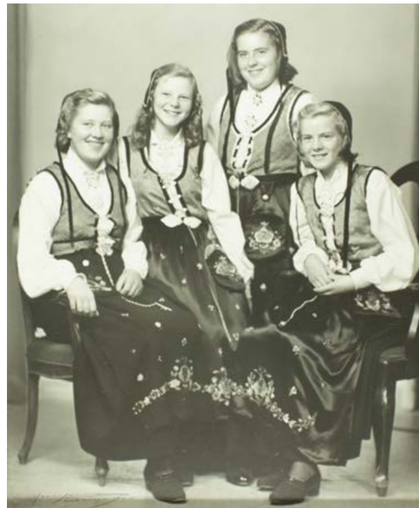
Bunadskledde konfirmantar frå Nærbø i 1949. Den gong var det ikkje vanleg å få bunad til konfirmasjonen.

I kyrkja stod konfirmantane alfabetisk, me var 5 jenter i bunad og me stod sist i jenterekkje. Dagen etter reiste 4 av oss til Stavanger for å verta fotograferte. Eg trur nok at me vekte litt åtgaurm både på toget og i Stavanger.