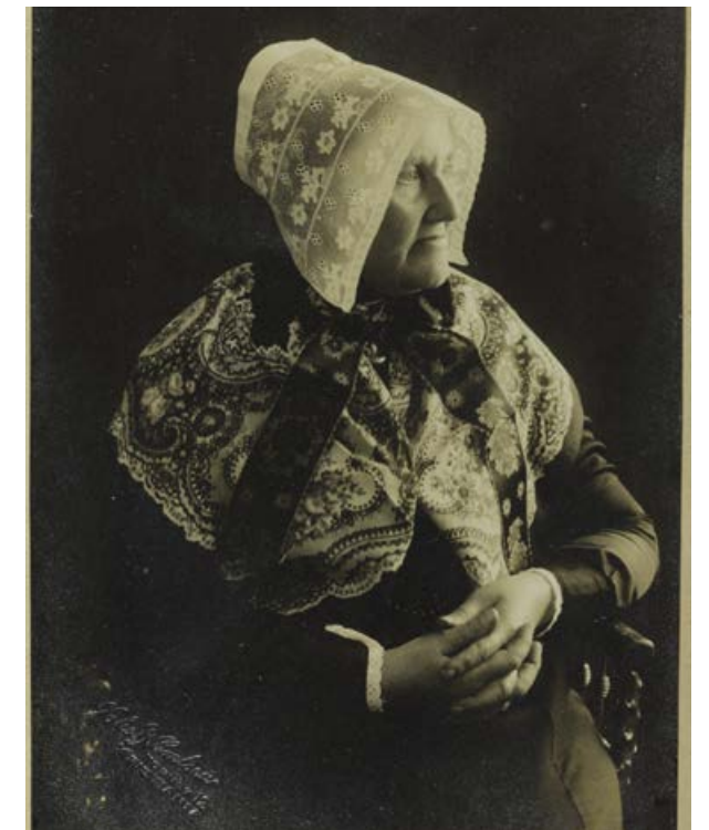
Konfirmasjonskledd kvinne frå Varhaug. Slik kledde konfirmantane seg i åra fram til 1870. Fotografiet er frå 1921.

«Som Kirkedragt bares paa Hovedet en liden Hue med flad bagudvendt Pull af kuløret Silke og med bre-