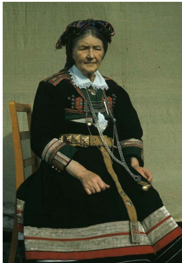
I Setesdal er det ubroten tradisjon frå folkedrakt til bunad, kategori 1. Kvinna frå Valle blei fotografert av Norsk Folkemuseum i 1967.

drakter som var prega av europeiske motar, men som likevel var ulike frå ei bygd til ei anna. Bunadar, slik ein bruker ordet innen folkedraktforskinga, er drakter som kun blir brukte som festdrakter, dei har aldri vore i bruk som vanlege klede.