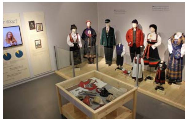
Utstillinga «Habitt/profitt – bunad i dag» på Garborgsenteret 22.10.2016–17.05.2017.

Bakgrunnen for kartlegginga av klesvala til konfirmantane våren 2016 var Garborgsenteret si bunadutstilling «Habitt/profitt – bunad i dag» som opna 22. oktober 2016. For mange heng bunad saman med konfirmasjon, og det er blitt stadig vanlegare å få bunad til konfirmasjonen, i alle fall for jenter. Konfirmasjonen har vore ein høgtidsdag, og ein dag for nye stasklede alltid. Men med tida har konfirmasjonsklede i større og større grad vorte synonymt med bunad for jentene sin del. I Jærmuseet sine samlingar finn ein spor av bunadskledde konfirmantar tilbake til 1949, men tradisjonen skaut for alvor fart utover 1980-talet.