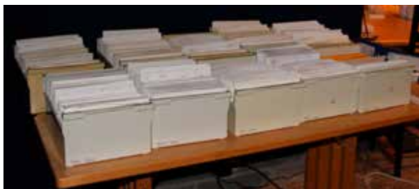
Hå Bygdemuseum har ei samling på nær 6 000 museumsregistreringar på papir. Den første databasen var utan digitale foto. Då blei opplysningane skrivne ut på papir og lagt i kortkatalogen.

Då er det på tide å venda tilbake til vår gjenstand – åtte-skillingen. Frå Varhaug Bygdemuseums katalog i 1960 får me i 1984 ei ny registrering – på trykte registreringskort. Her les me m.a.