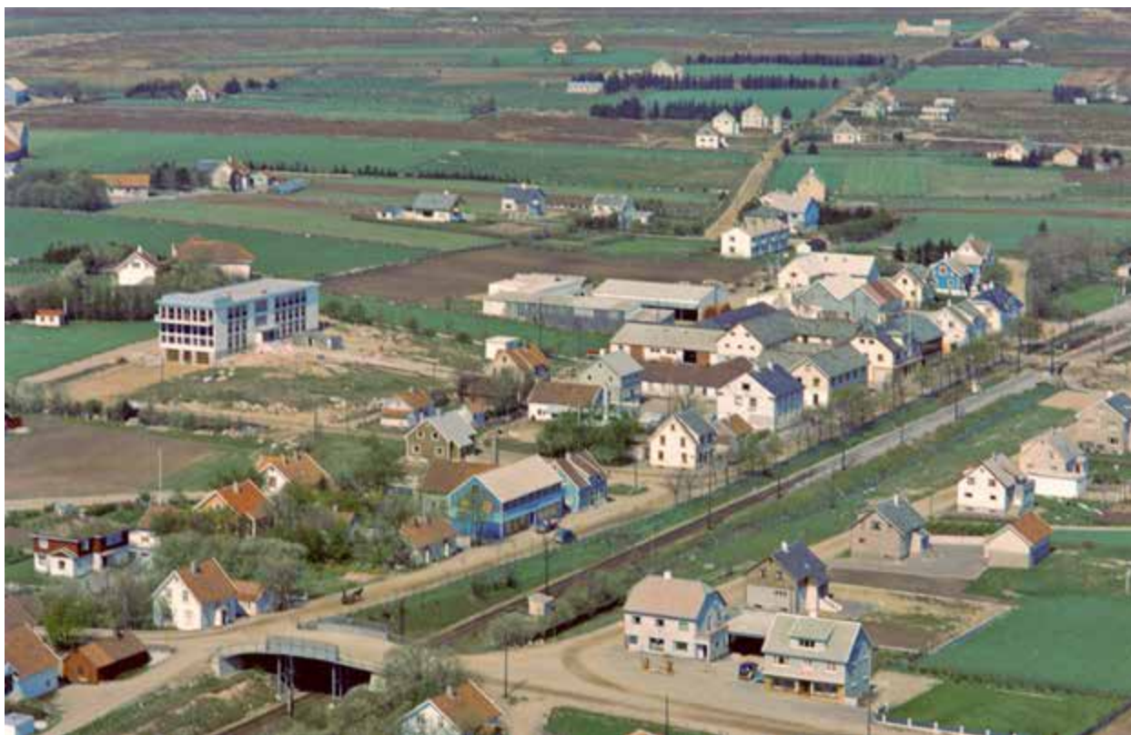
Det nye kommunehuset på Varhaug frå 1961 ligg i venstre kant av fotoet. Her fekk museumsamlinga plass i kjellaren.

enda med at Rogaland Folkemuseum kjøpte anlegget. Nærbø kommune bidrog med eit mindre beløp. Rogaland Folkemuseum var starta på 1930-talet. Det var først og fremst eit bygningsmuseum, som fekk hand om hus i Ryfylke og på Jæren. Museet sette husa i stand og i 1952 vart Grødalandstunet innvia.