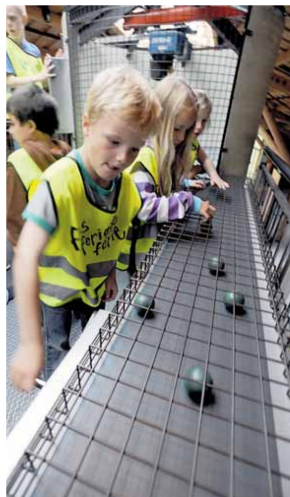
Teknikk: Lasting av «høyballer» er en populær aktivitet for ungene fra feriekлубben.