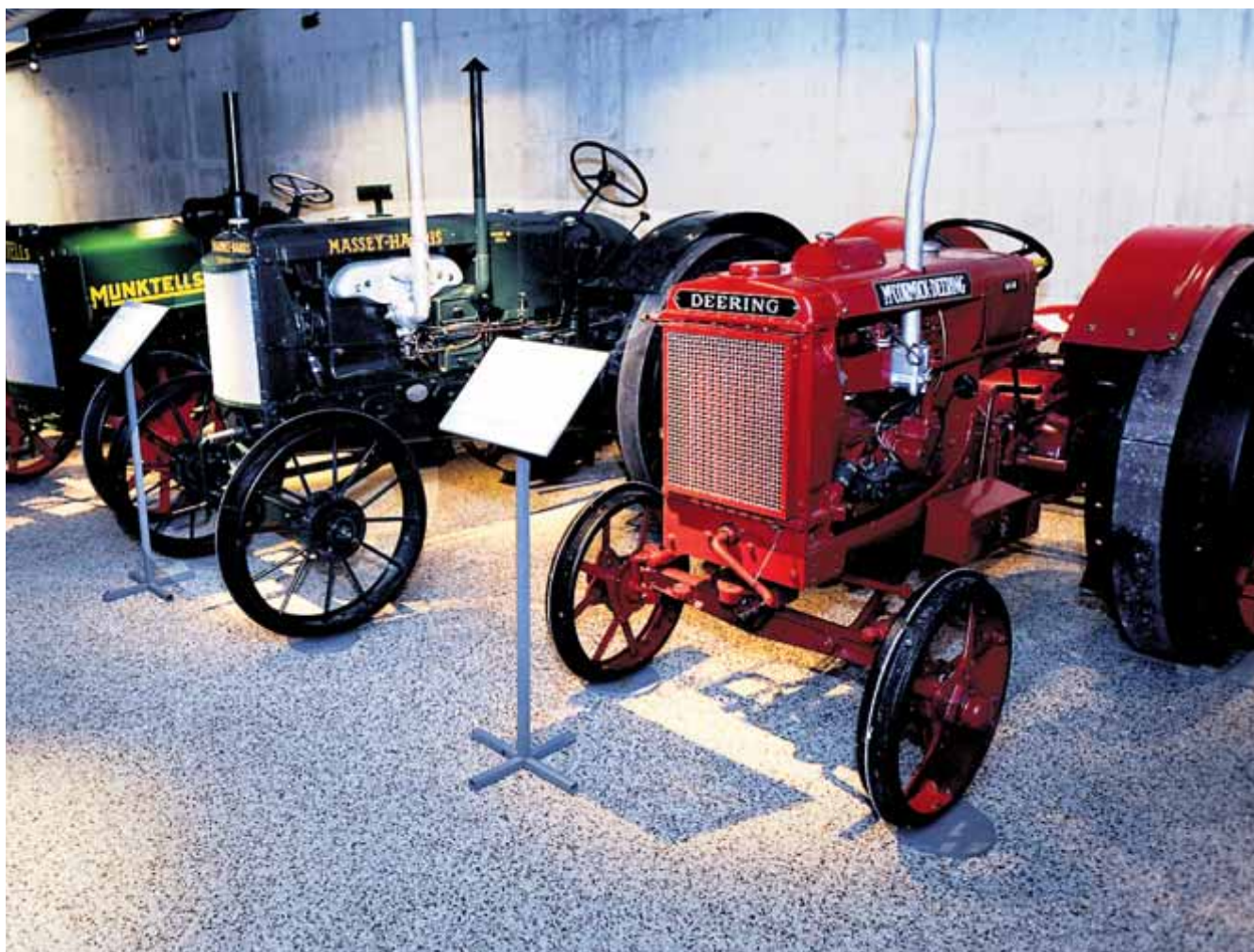
Museum: Vitengarden er både et museum og et vitensenter. I en av hallene står det en stor samling med veterantraktorer. Samlingen strekker seg over flere århundrer, og alle kjøretøyene er i kjørbær stand.