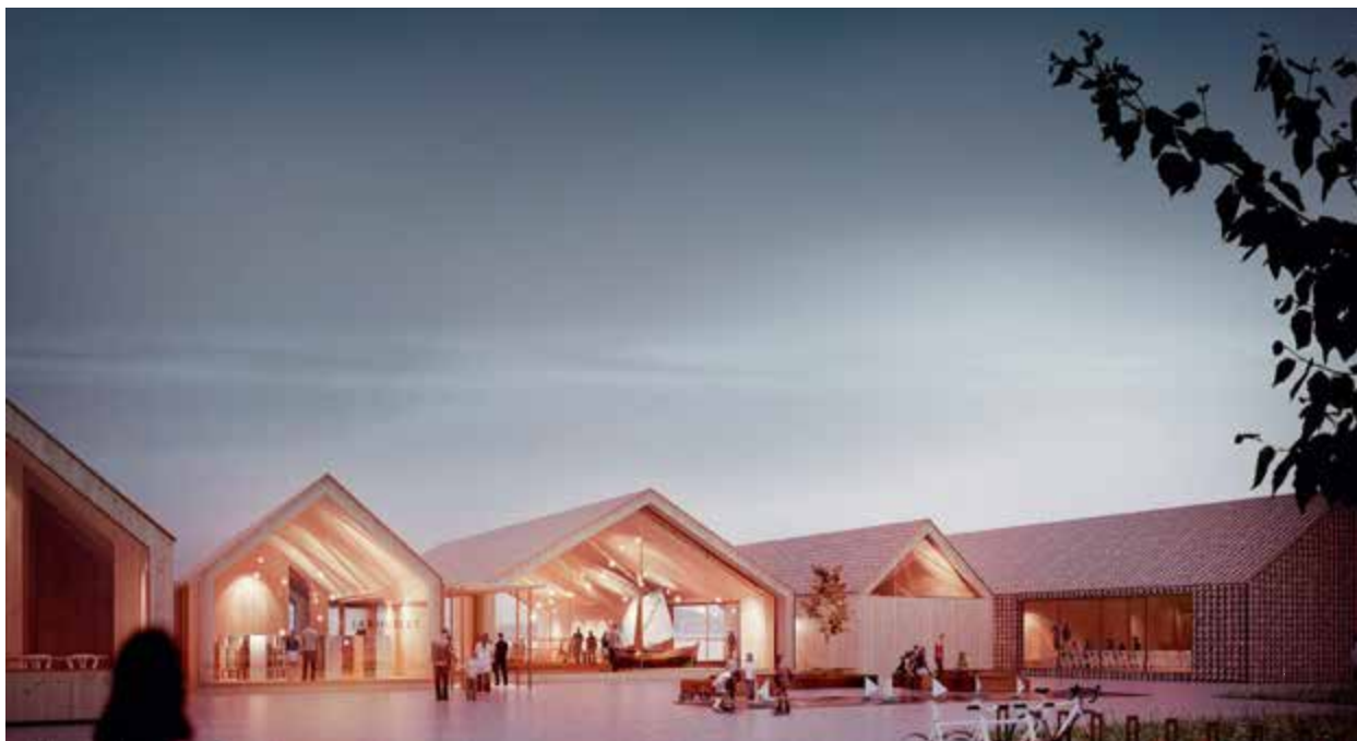
Utsnitt frå det premierte bidraget «Livdakra» av Trodahl arkitekter – Oslo og sivilarkitekt Espen Surnevik AS.

ligger godt plassert i bakkant av publikumsarealer på plan 1, og en egen avdeling for møter/utleie ligger godt plassert på plan 2. Utstillingsarealene kan avstenges fra resten av anlegget med et gjerde ved billett punkt på plan 1. Utstillingsdelen er svært vellykket, med et stort og lyst rom for de store gjenstandene, og små rom uten dagslys, der mindre gjenstander kan stilles ut med en egnet kunstig lyssetting.»