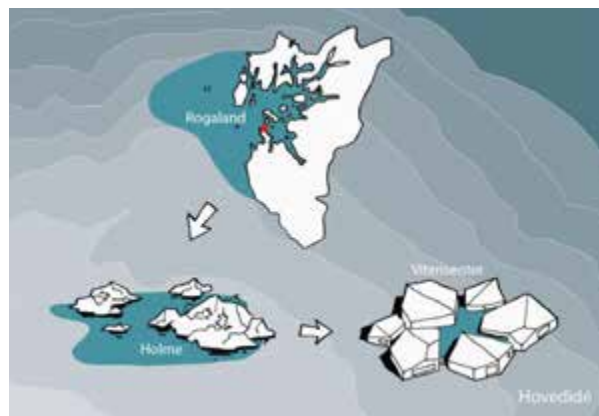
Frå kart til bygg – hovudideen bak bidraget «De seks holme» av Arkitektvirksomheden CRN.

Dette prosjektet består, som namnet tilseier, av seks holmeliknande bygningar som passar fint inn i land-