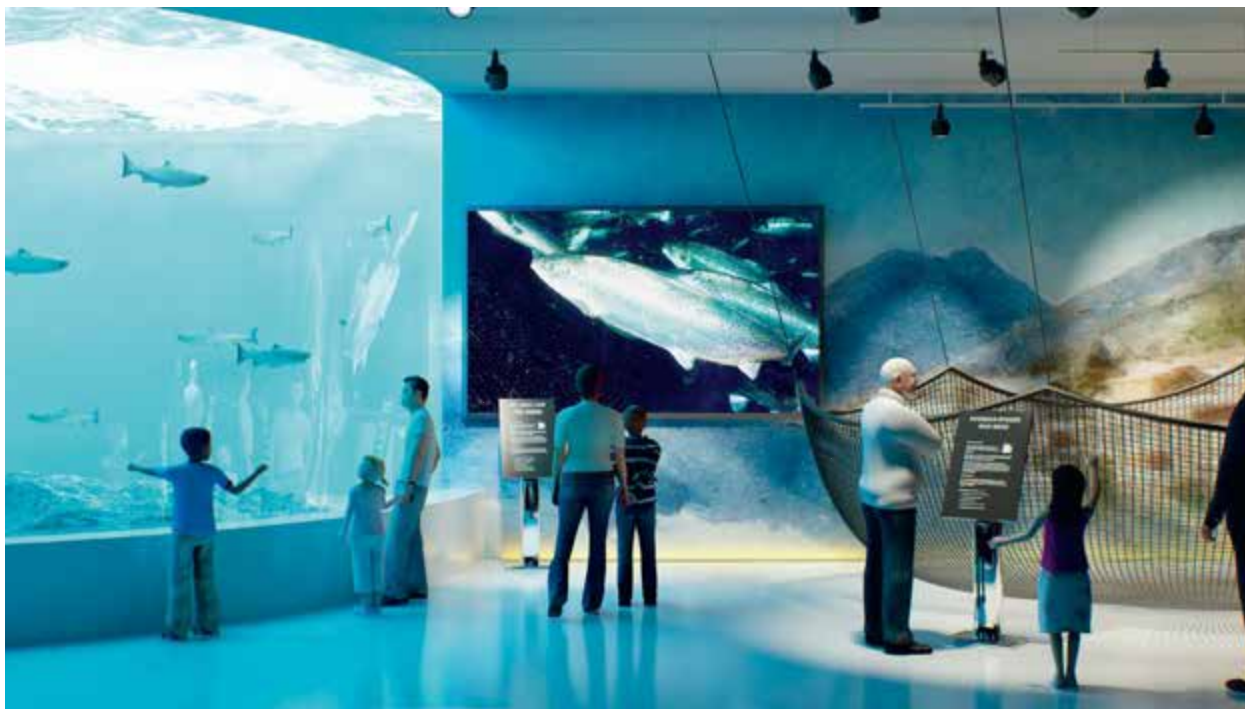
Havbruket skal formidlast via eit akvarium i vitensenteret. Illustrasjon: Tom Idland.

Det maritime vitensenteret skal vise oppdrettshistoria frå pionertida på 50- og 60-talet til dagens meir industrielle produksjon. Heile næringskjeda frå rogn til fisk skal formidlast gjennom engasjerande eksperiment.