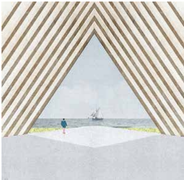
Utsikt frå forslaget «Triangel».