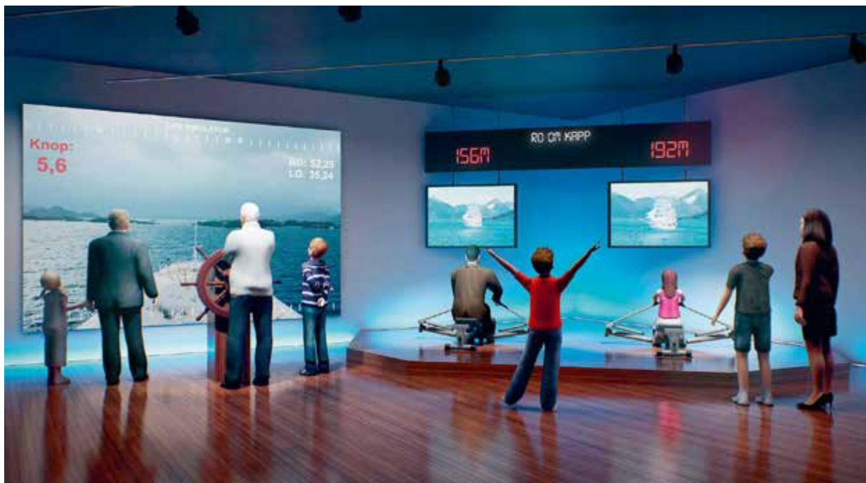
Eit tema for vitensenteret er lostenesta før og no. Illustrasjon: Tom Idland.

senter i Tungevågen, ved Tungenes fyr, som ein del av den samla vitensenterstrategien til Jærmuseet. Etter konsolideringa med Jærmuseet og stiftinga av Kystverkmusea blei vitensenterplanane for Tungevågen meir konkrete både frå Jærmuseet og frå Randberg kommune si side.