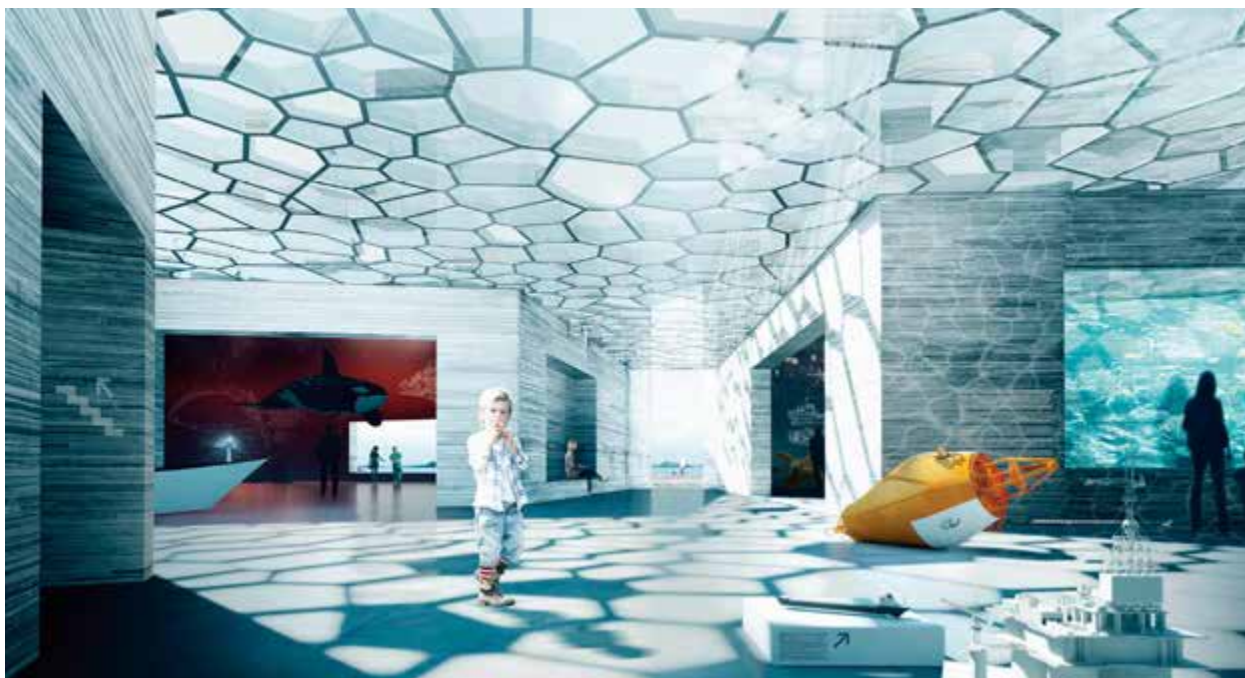
Ei utstillingsreise under havet i utstillingsrommet til bidraget "De seks holme" av Arkitektvirksomheden CRN.

Størsteparten av utstillingsarealet er i underretasjonen. Nausta får dermed i størst grad ein kulissefunksjon, noko juryen stilte seg kritisk til: «Dette grepet svekker anleggets funksjon som signalbygg, ved at uttrykket blir litt for anonymt.»