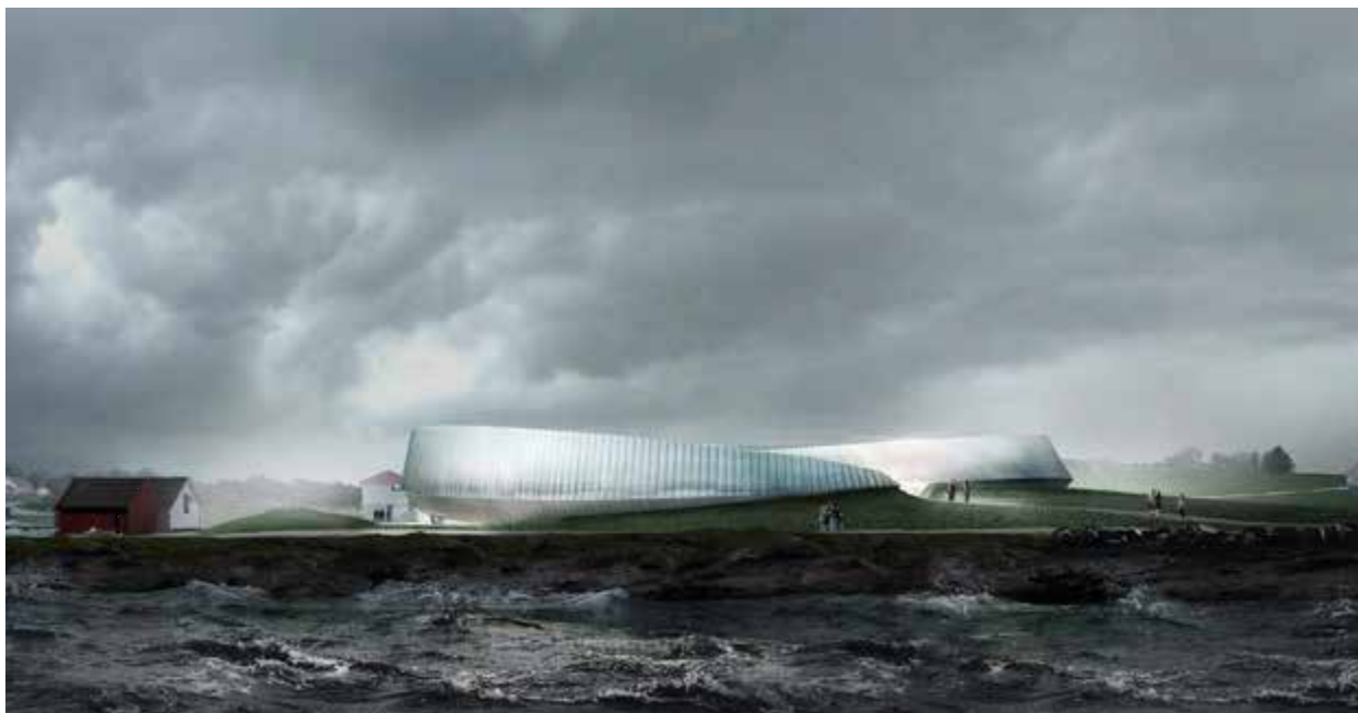
«Vidsyn», bidraget frå Asplan Viak AS.

skapet. Desse er bunde saman av ein samanhengande underetasje. Ideen med holmane synest å være henta frå Rogalandskartet, som ikkje nødvendigvis samsvarar med det lokale terrenget.