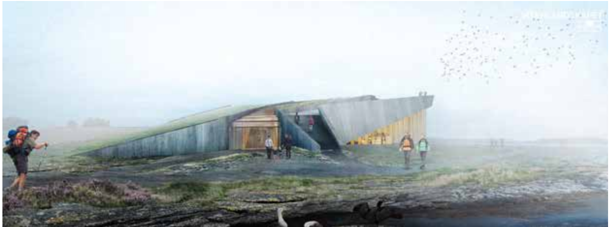
Vinnerbidraget «Vitenlandskapet» sett utanfrå, Rørbæk og Møller Arkitekter.

ber 2014 utlyste Randaberg kommune arkitektkonkurranse for det framtidige maritime vitensenteret. Då fristen gjekk ut i desember hadde 137 bidrag blitt påmeldt.