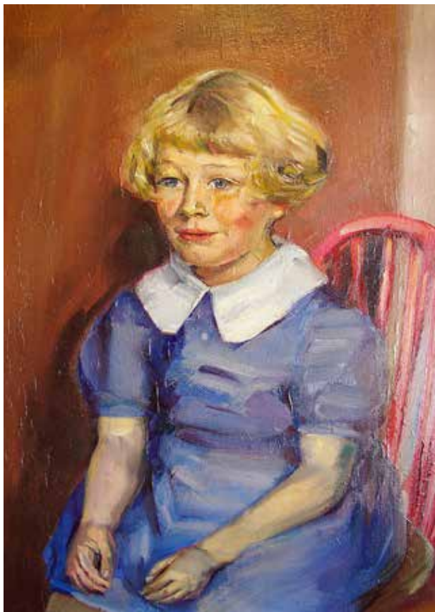
Herdis som barn.

femkløver som feiret 75-årsdagene sammen for få år siden, selv om vi bare hadde holdt sammen i 65 år.