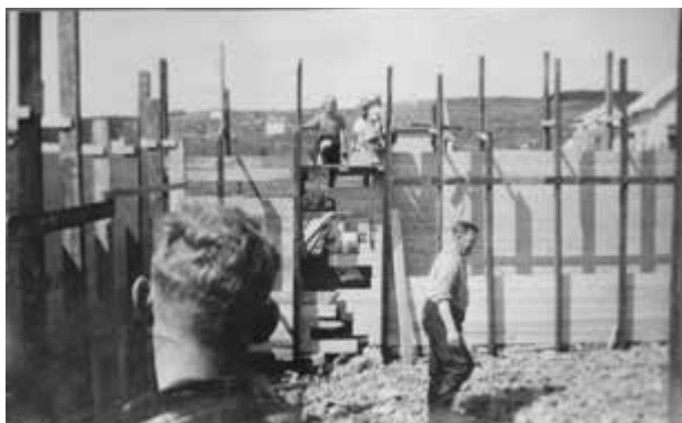
Husbygging i hagebyen på Kvernaland, ca. 1954.