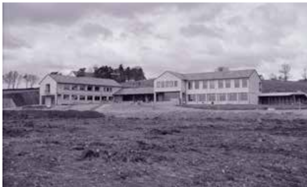
Frøyland skole, tatt 10.04.1959.