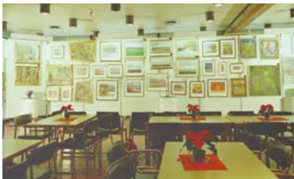
Utstillingen til kunstforeningen i Kvernelands Fabrikk AS i 1997.