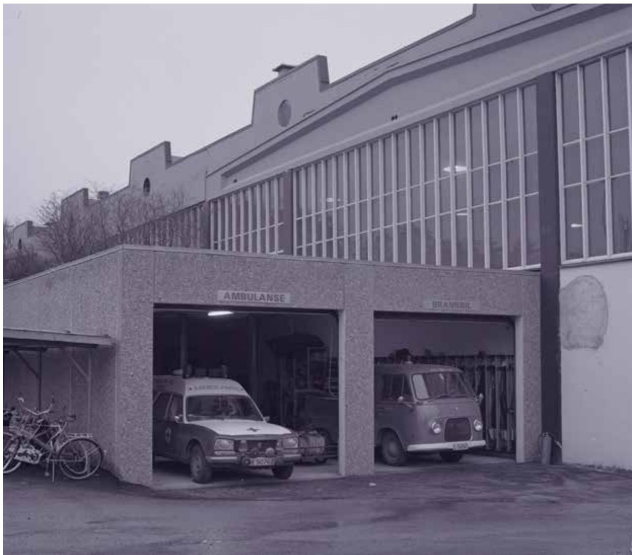
Garasjen for ambulansen og brannbilen lå rett ved inngangen til fabrikkområdet til Kvernelands Fabrikk AS på Frøyland.