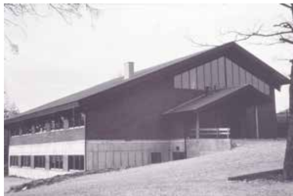
Samfunnshuset på Kverneland i 1983/1984.

Samfunnshuset på Kverneland, som det over en lenge periode var snakk om, blir endelig en realitet.