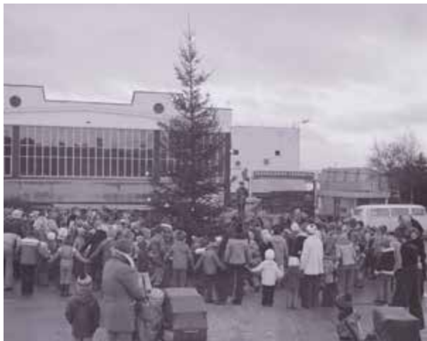
Juletre tennes med mange tilskuere foran Kvernelands Fabrikk AS 11. desember 1976.