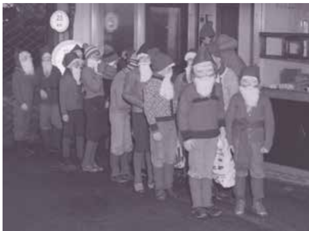
«Nissebesøk» på Kvernelands Fabrikk AS: barn utkledd som julenisser kommer ut av fabrikkporten på Frøyland 11. desember 1976.