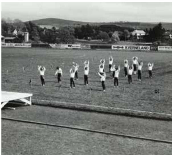
Turnoppvisning i det nybygde stadion til Frøyland I.L. i 1979, banneret for Kvernelands Fabrikk AS var godt synlig for tilskurere.