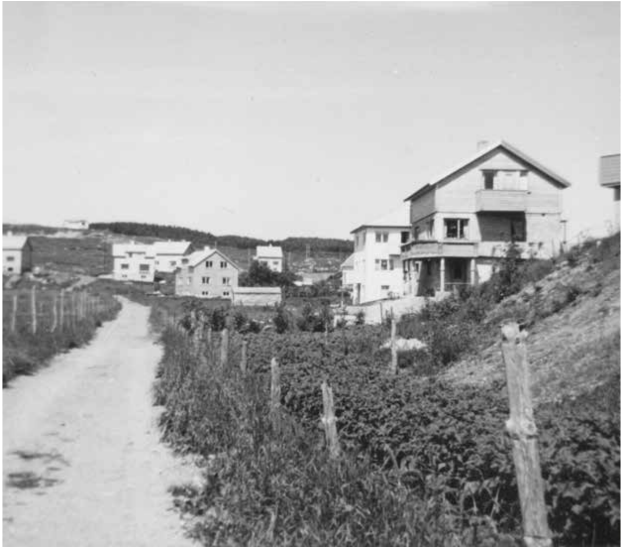
Husene til Kvernelands Fabrikk sine ansatte står ferdig i Skudebergveien på Kverneland AS 1955.