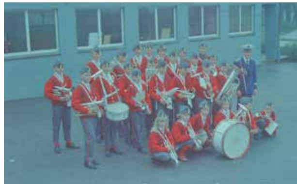
Elever fra Frøyland skolekorps foran Frøyland skole.