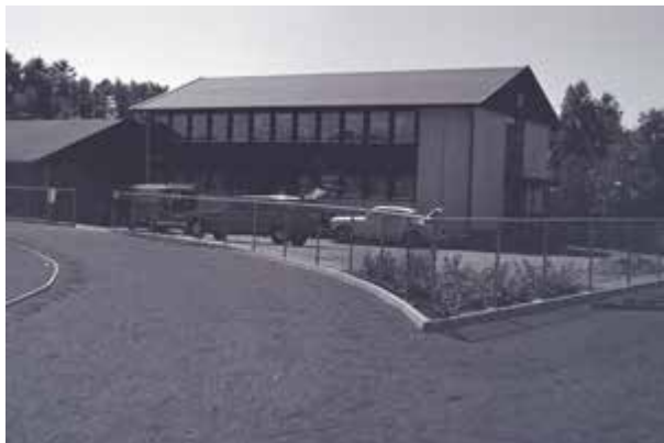
Biler foran klubbhuset til Frøyland I.L. våren 1978.

Frøyland Idrettslag åpner endelig sin etterlengtede idrettsplass etter flere år med innsamling av penger. Fabrikken bidro mye, blant annet ved kjøp av tomt og ved å låne ut utstyr gratis for å opparbeide området. 52