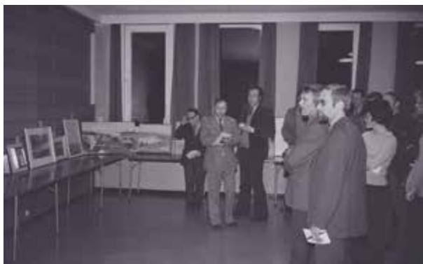
Medlemmer i Kunstforeningen ved Kvernelands Fabrikk AS ser på utstilt kunst, desember 1973.