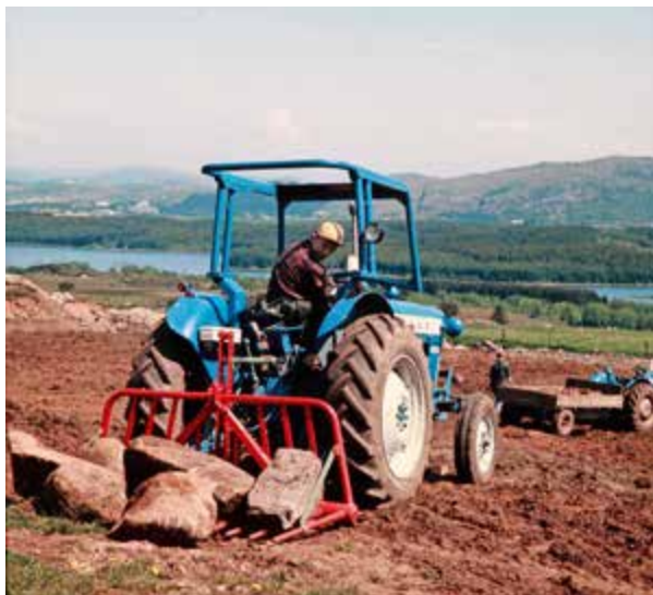
Redskaper som steinsvansen fra Kvernelands Fabrikk AS har lettet arbeidet med å rydde stein frå åkrene. Steinbukken trengtes det mindre og mindre.

Det å være dyktig bonde har vært og er fremdeles en del av jærbuen sin identitet eller selvbilde. Det er en måte å tenke på som mange har felles, slik at vi kan snakke om «mentalitet». Mentaliteten forandrer seg oftest saktere enn det materielle, og er historien om historien sin langsomme forandring. 31 Slik er det med det som er viktig for vår identitet, det som er blitt