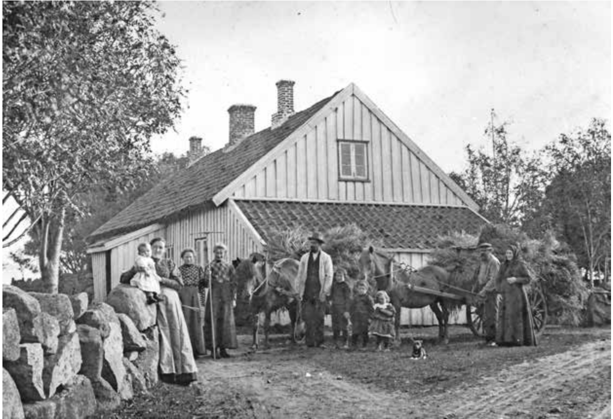
Det var ikke ofte det ble tatt bilder i gamle dager. Her viser man seg fram med gårdens folk, innhøstet korn og hestene. Og så måtte jo hunden få være med.

gen la rammene som vi måtte forholde oss til. Det er disse faktorene som gjør at vi som personer ikke alltid handler «rasjonelt» ut fra «mål og nytte». Den kollektive samfunnsforståelsen og tenkemåten – mentaliteten – blir derfor helt avgjørende for vårt felles handlings-