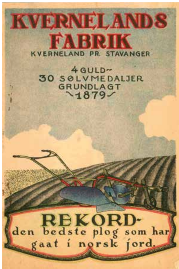
Brosjyre for Rekord-plog. Brosjyre fra arkivet til Kvernelands Fabrikk AS, Jærmuseet.

Pragmatisme og en «bonde-teknokratisk» holdning til jordbruket har spilt en avgjørende rolle for utviklingen på Jæren på 1800- og 1900-talet. I dette ligger det likevel flere spenninger enn de som bare gjelder