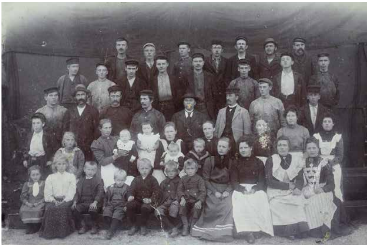
Det var viktig å vise seg fram med små skiller mellom folk. Ansatte ved Kvernelands Fabrikk ble sett som en del av familien rundt år 1900.