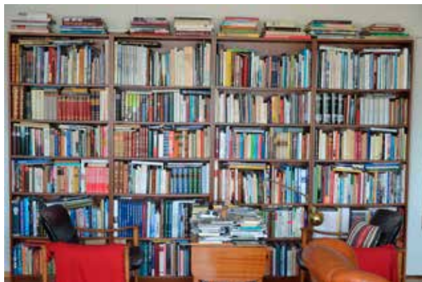
Bokhyllen er lokalhistorie, krigshistorie og et kunstverk i seg selv.

En tid var jeg knyttet til spesialskolen Ramsvig, fungerte både som avdelingsleder og kurator. Disse elev-