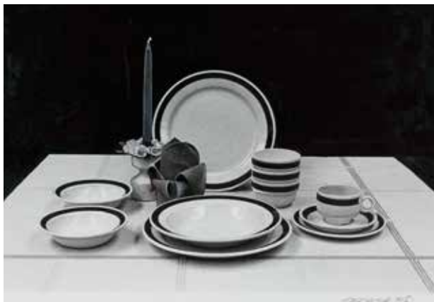
Reklamefotografi av serviset til S/S Norway.

I 1980 var S/S «Norway» med 2 400 passasjerer verdens største cruiseskip. Serviset på dette skipet ble produsert på Figgjo og designet av Rolf Frøyland.