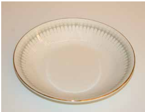
Dessertskål i dekoren «Symfoni».