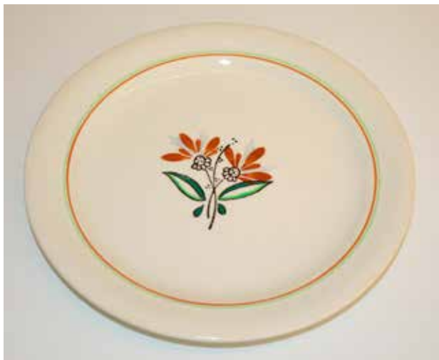
Frokosttallerken i dekor «Gro».