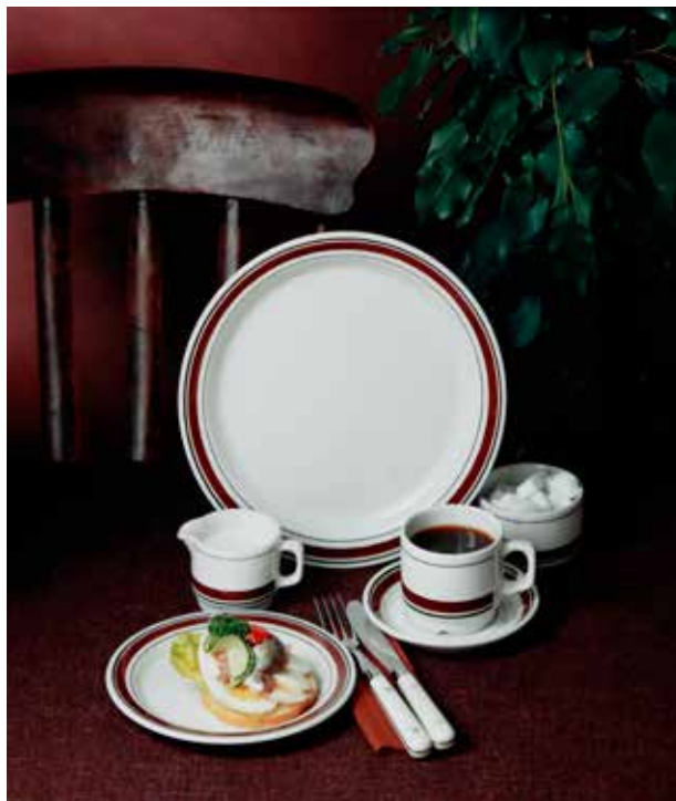
Reklamefotografi for Vera brun.

Dekoren «Vera» ble designet av Rolf Frøyland for modellen 3500 fra Ragnar Grimsrud. Dekoren ble levert i to fargevarianter grønn og brun.