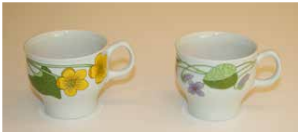
Dekorene «Bekkeblom» og «Fiol» på koppene til modellen «Nidaros».

5 = tåler alle matretter 5 = tåler oppvaskmaskin