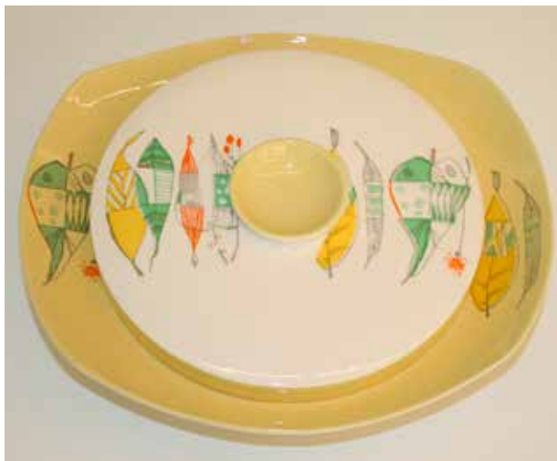
Terrin i dekoren «Høstløn».