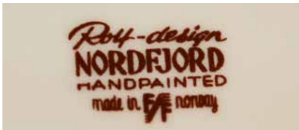
Vignetten på undersiden av delene til serviset «Nordfjord».