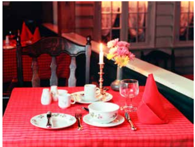
Fotografi av serviset «Fjellblomst» for SAS Royal Atlantic Hotel i Stavanger. Bildet ble brukt i en reklamebrosjyre og er tatt i restauranten til hotellet, «Mortenpumpen».

Dekoren «Fjellblomst» ble mellom høsten 1982 og høsten 1986 levert i 13 314 deler til hotellet, dekomen «Blå blomst» ble levert i 20 026 deler i samme tidsperiode. 10