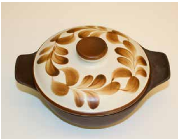
Terrin i dekoren «Pompei».