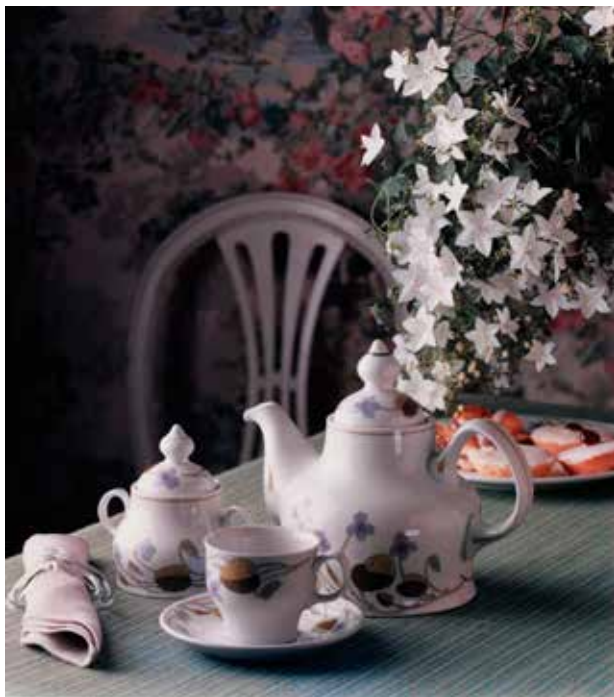
Reklamefotografi for serviset «Fiol».