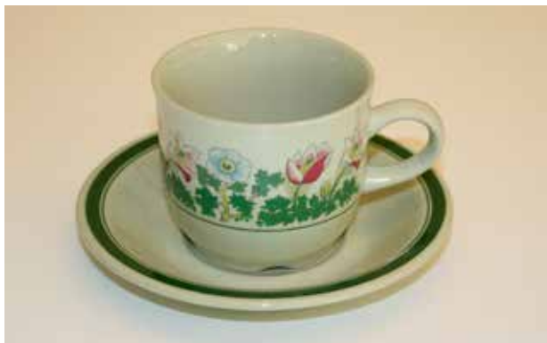
Kopp og asjett i dekoren «Anitra».

Serviset ble lansert i midten av 1975 og gikk ut av produksjonen ved årsskifte 1985/1986.