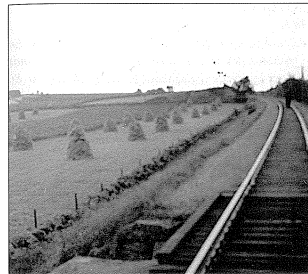
Korn i stakk ved jernbanelina. Utsyn mot Gjerdå og Kuhagen i sør.

29.4. Første bredspore tog forbi: 2 lokomotiv, 1 rammevogn, 2 boggier og en stutt konduktør-