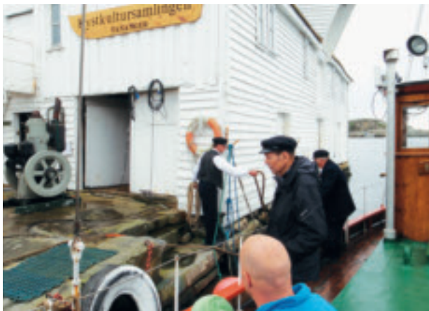
Kystkulturdag i mai 2009 med program for store og små. Kommunane Sola og Randaberg var lokale arrangørar i samarbeid med Jærmuseet. Kystkulturdagen var del av ei større landsomfattande markering av Kulturminneåret i samarbeid med Kystverkemusea.