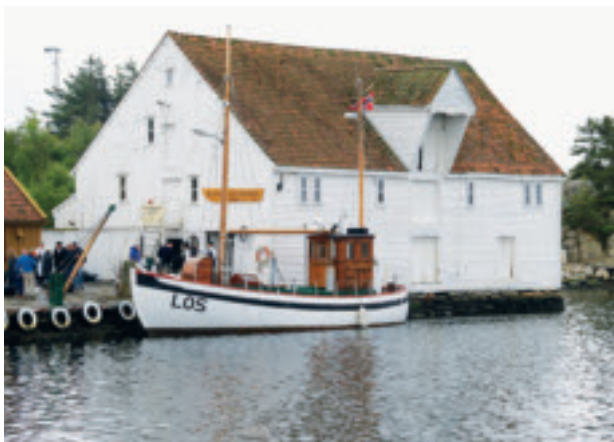
Kystkultursamlingen i Tananger held til i Melingsjøhuset frå 1851.