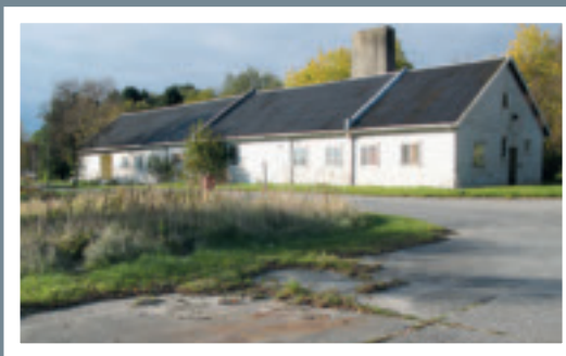
Flyhistorisk Museum har kontor, bibliotek og lagerrom i den såkalla 720-brakka i Sola Sjø.