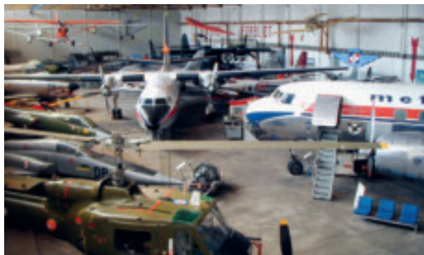
Utstillinga til Flyhistorisk Museum Sola fotografert i 2004.

Museet blei formelt stifta med konstituerande generalforsamling i 1984. Etter kort tid hadde dei fått klubblokale og lagerlokale, den gamle støttevingbrakka og hangar 0 i Sola Sjø. Året etter, i 1985, flytte museet og fekk plass i hangar 1 i Sola Sjø. Der held museet framleis hus. Plassen har gradvis blitt utvida med meir utstillingsrom, verkstad og kafélokale. Ivrigt entusiastar kasta seg utan frykt over oppgåvene med å byggja opp