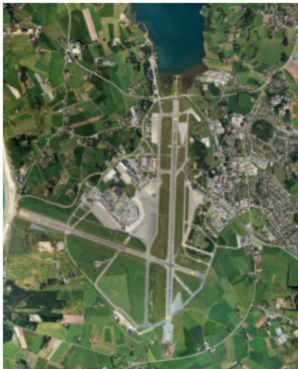
Arealet innafor den gule linja, ca 4900 mål, markerer flyplassområdet i kommuneplanen for Sola kommune. Kart: Sola kommune – Virksomhet Arealbruk. Målestokk 1: 2000

Både i krigstid og i fredstid har sivil og militær flyaktivitet sett sitt preg på Solasamfunnet og regionen. Den