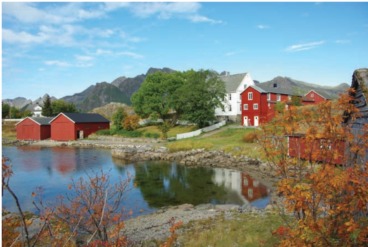
Lofotmuseet med væreiergarden i Storvågan.