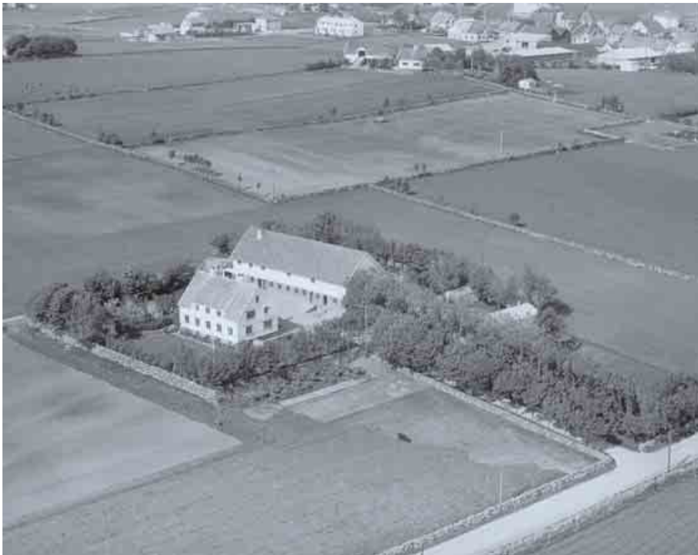
Flyfoto av Lensmannsgården på 1960-talet.