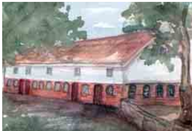
Illustrasjon av løa laga i 2008 av Marit Aanestad.

Etter oppfordring frå politisk hald vart det skipa ein dugnadsgjeng som tok på seg praktisk arbeid i sam-