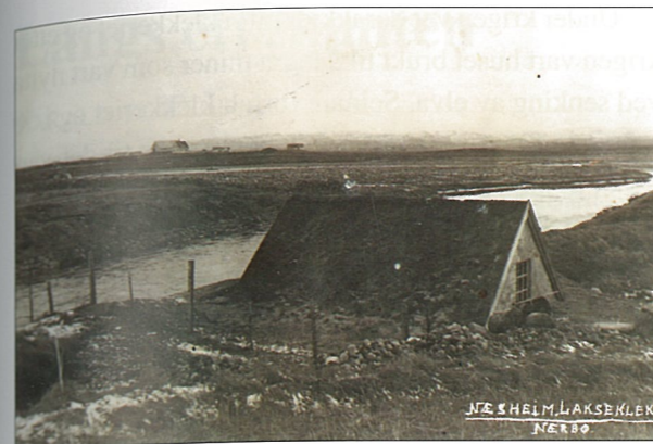
Lakseklekkeriet på Nesheim, me ser nordaustover mot Søyland.

For dei som hadde mindre gardar, kunne inntekta av laksefisket på den tida koma vel med. På dei større gardane var det også mange som var interesserte og