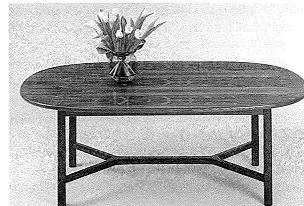
«Fønix» var ein kombinasjon av blomsterbord, barskap og pyntebord.

Dei første åra sleit me med å koma i gang med egne produkter.