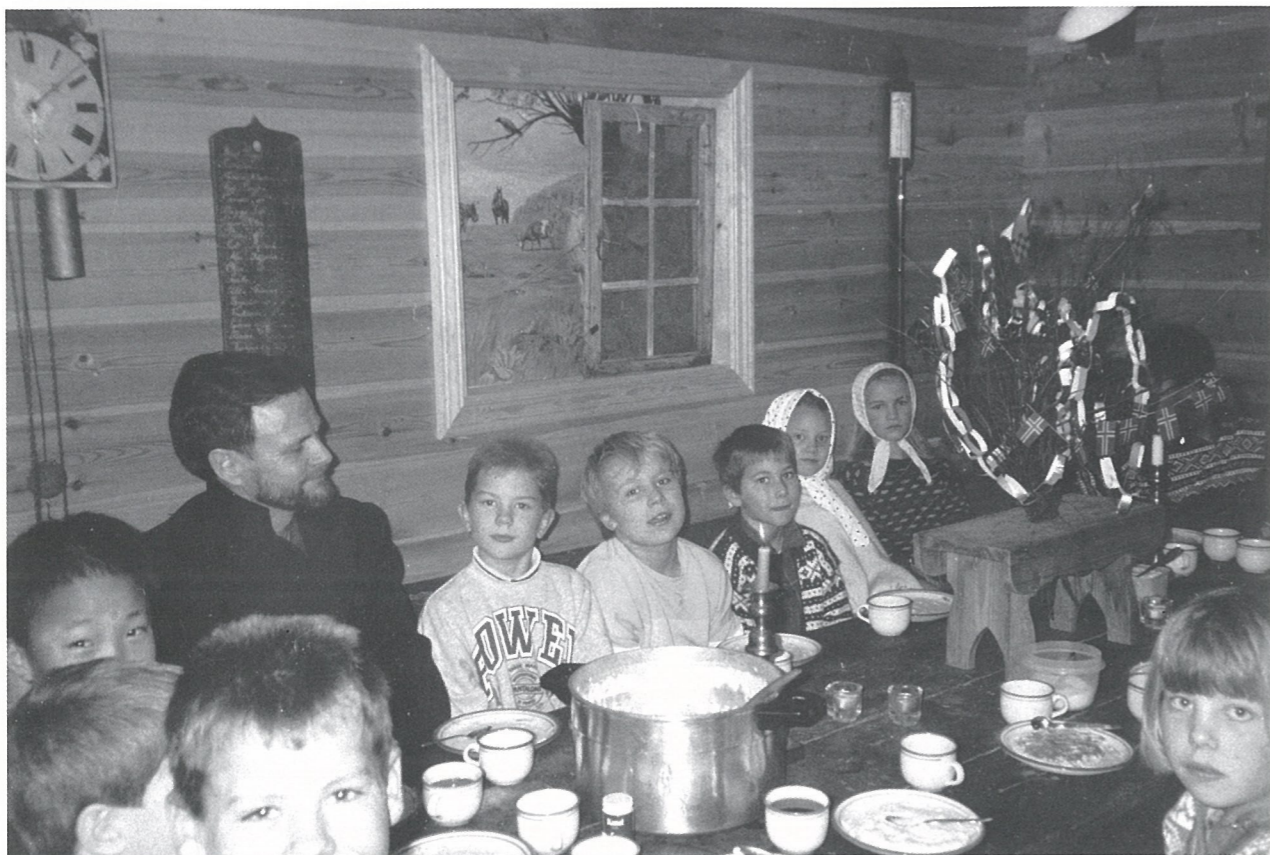
Førljulsstemning, bygdemuseet på Harestad skole. Forfatteren sammen med elever. * Forfatteren