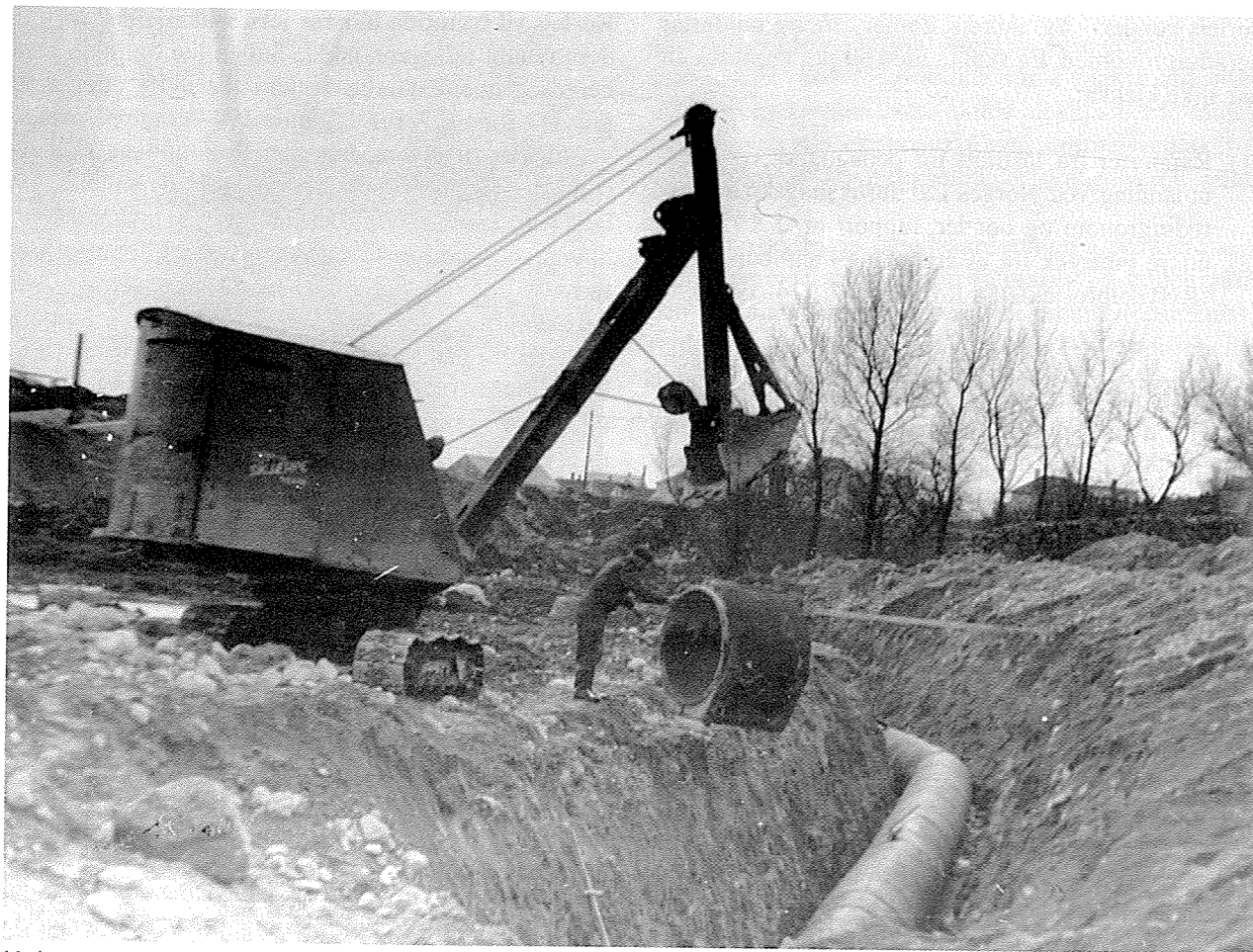
Moderne teknikk har overteke kanalgravinga. Nærbo 1954

Men utviklinga er sterkt avhengig av det som vil skjje elles i samfunnet, og det er uråd å ha skråsikre oppfatningar om framtida i så måte.