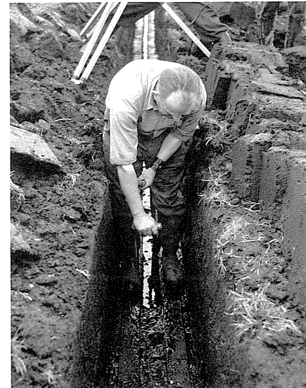
Graving av plyttgrøft, Nærbo 1953

Som nemnt fekk me dei første heradsagronomane i Rogaland i 1917. I 1919 kom Nord-Rogaland med då det vart tilsett heradsagronom i Skåre, Torvastad og Avaldsnes. Klepp fekk heradsagronom i 1920. Same året vart heradsagronomdistriktet Håland og Hetland/Randaberg delt, såleis at Håland vart eitt distrikt, dei 2 andre kommunane det andre. Utsira kom med i 1924, saman med Torvastad, Skåre og Avaldsnes. Men ti-