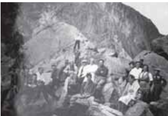
Nok ein sykkelstur. Denne gongen er det pust i bakken i Gloopedalsura.