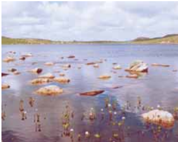
Her på Bokkatjødna arrangerte Tunheim Ungdomslag skeiserenn.

Kanskje det raraste stemnet: Det gjekk av stabelen 3. mai 1946. Nett kor tevlingane fann stad, veit eg ikkje, men det står nemnt Ungdomshuset. Eg vil tru at det var Forsamlingshuset. Det var ungdom frå eige lag med inviterte gjester frå Bråstein og Figgjo som tevla. Det skulle tevlast i høgde- og lengdehopp utan tilløp. I lengde for ungdom over 18 år vann Tunheim suverent medan i gruppa under 18 vart det likt med 11 poeng på kvart lag. Det heiter om høgdehopp at "resultata var dårlegare enn venta". Grunnen til at Tunheim sine folk vann så suverent i den eldste klassen, var at tunheimskarane hadde trent heile vinteren. 20,5 poeng til Tunheim og 1,5 til dei to andre.