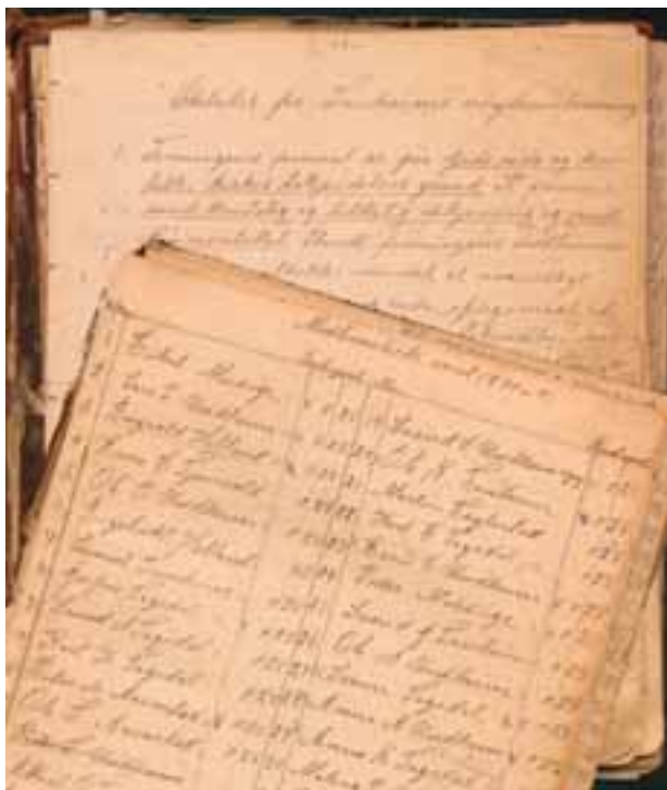
Første lagsprotokoll med statuttane og medlemslista frå 1890-91. Arkivet til Time Ungdomslag.