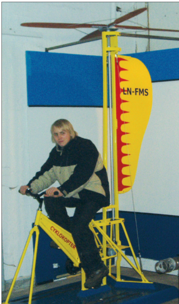
Syklokooperet. Hausten 2004 kom ein ny interaktiv stasjon, Syklokooperet, på plass på Flyhistorisk Museum Sola og har blitt ein populær aktivitet. Men her kjem du ikkje høgt sjølv om du trør i veg, for hittil har ingen klart å byggja eit helikopter som kan letta bare med muskelkraft.

nistrative sidene ved drifta og ikkje minst styrka dei lokale anlegga si rolle som formidlingsarenaer – særleg mot grunnskulen. Dette oppfatar me også som ein viktig intensjon ved Museumsreforma. Jærmuseet har så langt omdisponert noko formidlingsressursar frå hovudanlegget på Kvia til Limagarden i Gjesdal, og brukt midlar frå Den kulturelle skulesekken til å få utarbeidd særleg tilpassa undervisningsopplegg. Dette arbeidet vil bli ført vidare i 2005.