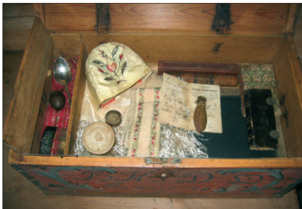
«Kva gøymer seg i skuffer og skap?» Skatter frå samlinga utstilt på Grødaland.

beidsområde – som for vårt vedkommande er knytta til samtid og nær fortid.