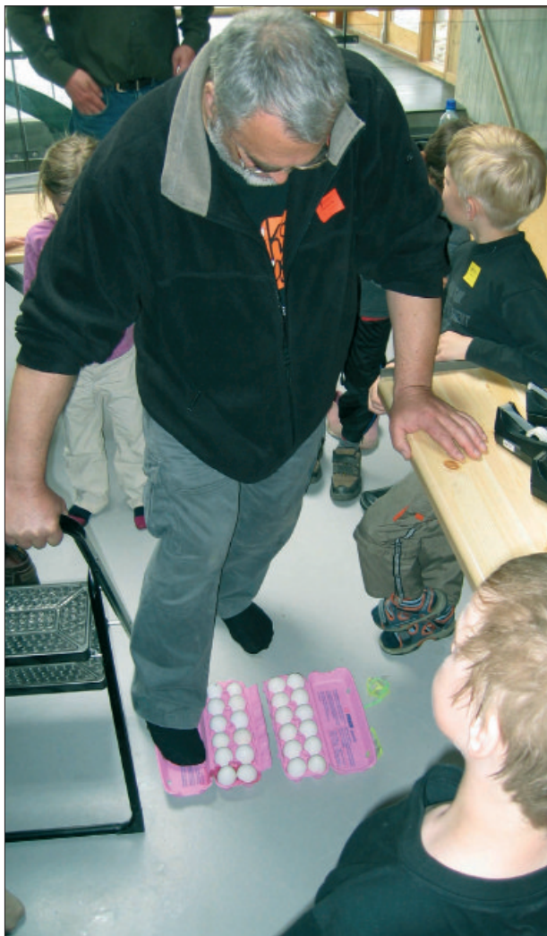
«Eggande dag». Toler egga at eg står på dei? Sondag 9. mai blei det arrangert «ein eggande dag» på Jærmuseet Kvia. Denne dagen fokuserte me på fjørfehald og eggproduksjonen på Jæren, og publikum fekk bli med på ulike eksperiment og aktivitetar med egg. Dette temaet har også fått sin eigen stasjon i dei nye utstillingane.

Jærmuseet har i hovudsak berre tatt imot gjenstandar som høver med innsamlingsplanar og prioriterte ar-