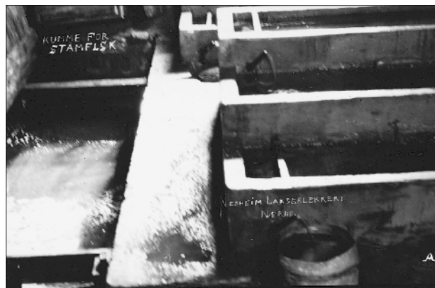
Kummar for stamfisk i lakseklekkeriet på Nesheim.

som nytta kvar anledning til å fiska i elva.