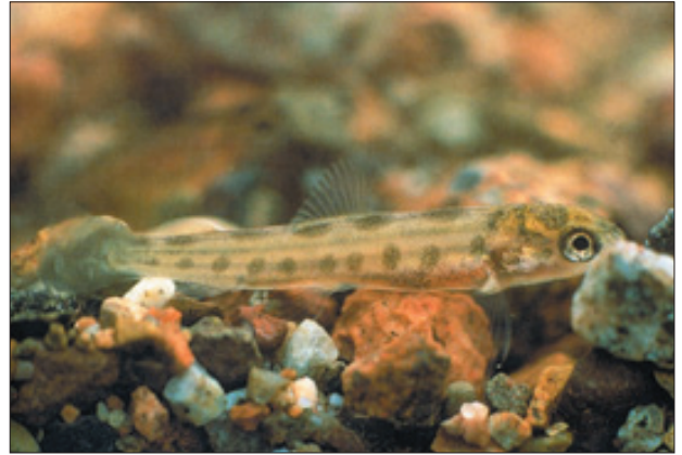
Laksyngel. Suldalslågen. Laks og kraft, Statkraft Grøner as, 2000.

Lakserogna ligg nede i grusen heile vinteren og klekker tidleg i april. Lakseyngelen er då lite utvikla, og har plommesekk under magen. Yngelen held seg nede i gytegroppa ennå tre-fire veker før dei kravlar seg opp gjennom grusen, startar å ta til seg føde og etablerar seg på eit eige territorium. Svært mange lakseungar