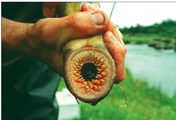
Med dette gapet lurar havniøyene seg innpå større fisk. Med hornmennene biter den seg fast bak på fisken, og suger ut muskler og innvoller til fisken dør.

opp mot ein meter lange, og er brunlege med lysare marmoreringar over heile kroppen. Dei er svært lette å oppdage om sommaren på lite vatn. I Håelva finst dei heilt opp til Fotlandsfossen. Elveniøyene er grålege og einsfarga. Dei vert opp til ein halv meter lange. Desse gyt truleg mest i dei nedre delane av elva, opp til Haugland. Bestandane i Håelva ser ut til å variere mykje. Nokre år er det mange dyr på gyting om sommaren og dei har ein like fasinerande gyteleik som laksen. Andre år ser ein mest ikkje dyr på gyting i det heile.