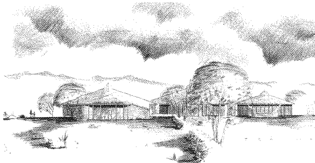
Nybygget til Jærmuseet slik det vil sjå ut frå Hanaberget.