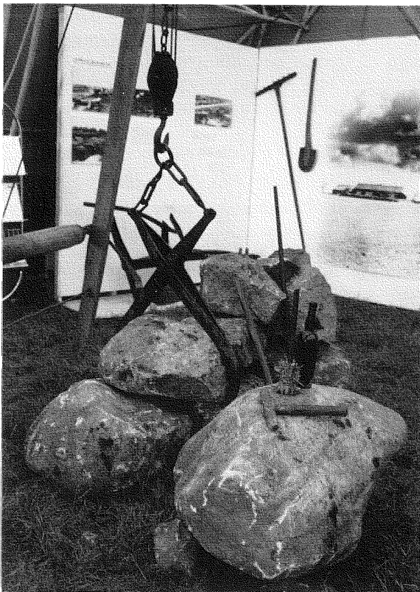
Under landsstemna til Norges Bygdeungdomslag på Nærland laga Jærmuseet m.a. ei lita utstilling om steinarbeid.