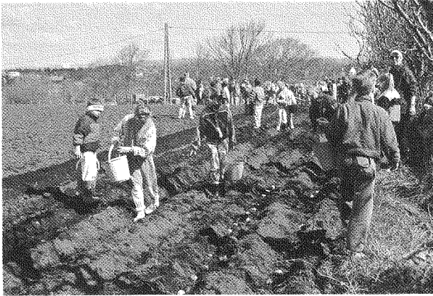
Vårvinna på Kviagarden. 4H-klubbane i Hå set poteter på Kviagarden.