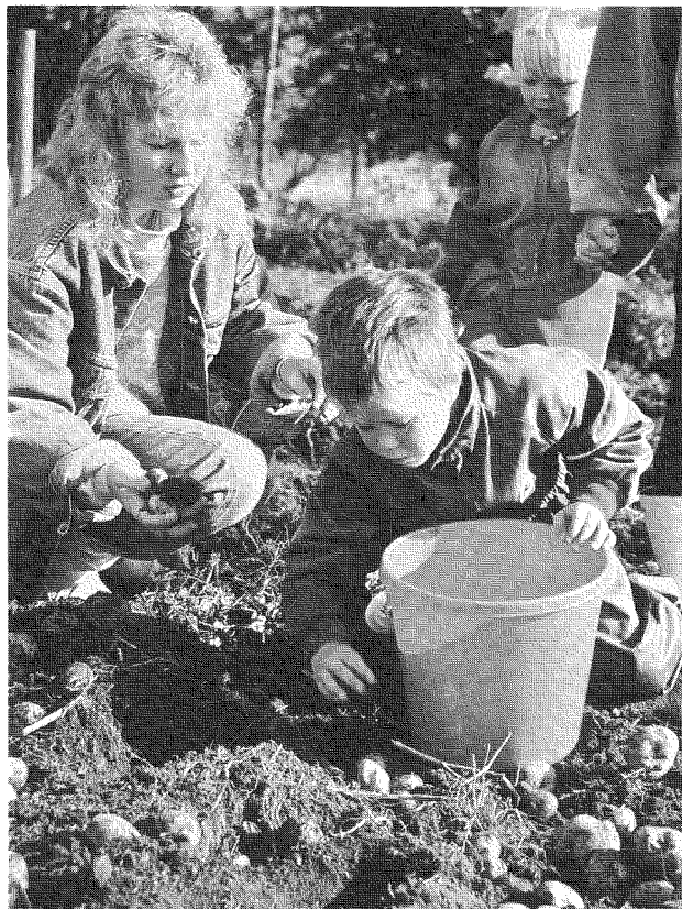
Potetene blir hausta med stort alvor og konsentrasjon.

Heller ikkje dette året har Jærmuseet fått nokon form for volumauke. For Jærmuseet inneber dette at me stadig får ein mindre del av dei statlege og fylkeskommunale tilskota samanlikna med dei andre regionmusea.