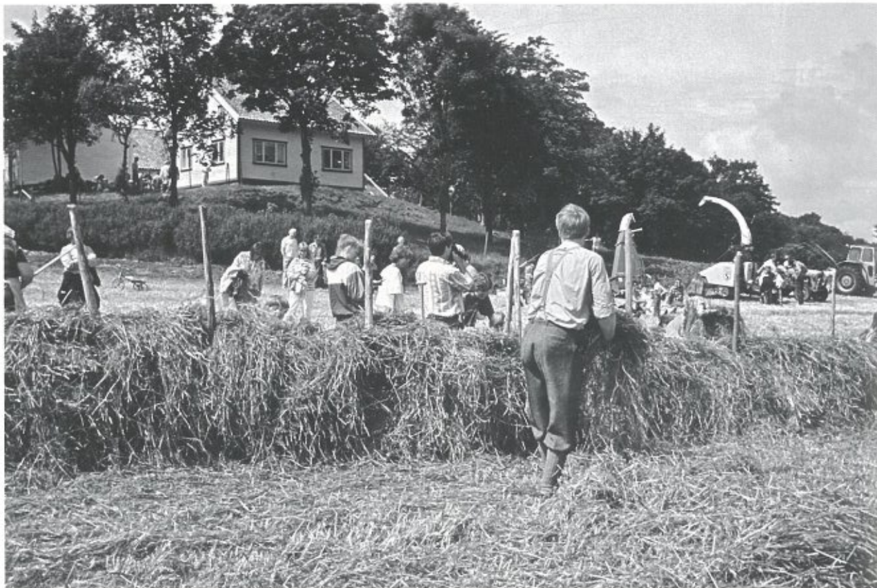
"Slåttedag" på Kvia. Små og store tek ivrig del i hesjinga. * Foto: Jærmuseet 1992.

Dessutan synte det seg at "ekte kumjolk" frå Kviagarden var svært ettertrakta.