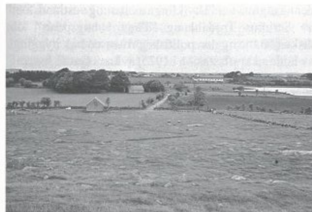
Frå Audamotland *