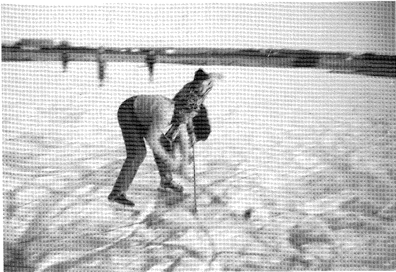
Kåre Skretting bak og Steinar Lode i kamp med heimelaga ishockykøller.