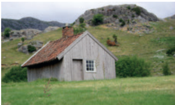
Ljåsmie med bakarovn på indre Lima.