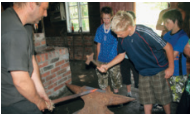
Under «Limavatnet rundt» får elevane prøva seg i Gjesdal Ljøfabrikk.

blei tilbudet utvida med nokre dagar. Det er åpent for publikum kvar søndag frå mai til ut september, og sommaråpent seks dagar i veka i juli. Det blir laga til aktivitetsdagar enkelte søndagar.