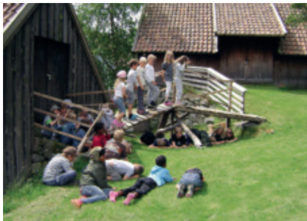
Under aktivetsveka i 2009 dramatiserte ungane «Bukkene Bruse» med liv og sjel.

Skule – landbruk er eit samarbeid mellom Gjesdal Bondelag og skulane i kommunen som har pågått frå sist på 1990-talet. Dei har tre faste undervisningsopplegg: Limavatnet rundt i juni, Frå ull til tråd i oktober og Jul på gammalt vis i desember. Jærmuseet har frå