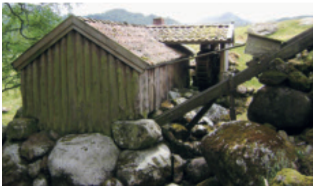
Kvernhus med turke på Ytre Lima.

Dette kvernhuset blei restaurert på 1970-talet som del av museumsarbeidet.