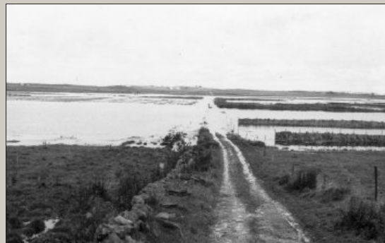
Det regna jamt og mykje i to døgn. Det sette sine spor. Det er lite ein kan gjera for å berga kornet på hesjene, og mykje korn kom ut på sjølvstyr. Poteter og gulerøter tok skade, og eng og beite vart øydelagt av slam. "Bondevennen" meinte det var tap på hundretusenvis. Biletet er frå Bjorland-Torland.