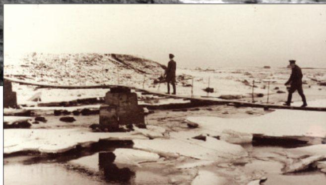
Biletet er teke av isgang under siste krigen med to tyskarar på veg over hengebrua mellom Hå og Njærheim.