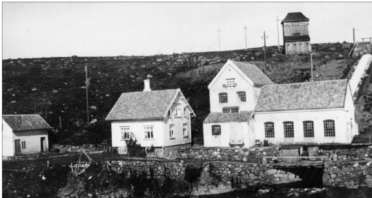
Kraftstasjonen på Fotland sto ferdig i 1915 og gjorde teneste til sommaren 1972. I dag er det museum.

Verket på Høyland vart ikkje nokon suksess. Soga fortel at det var i drift ei kort tid. Det skulle ha lege for nært med åa, vart det hevda. Braut Vigre hadde fått fortalt at det vart for mykje graps som kjøvde inntaket for vatnet. Det er rimeleg at bae grunnane er haldbare.