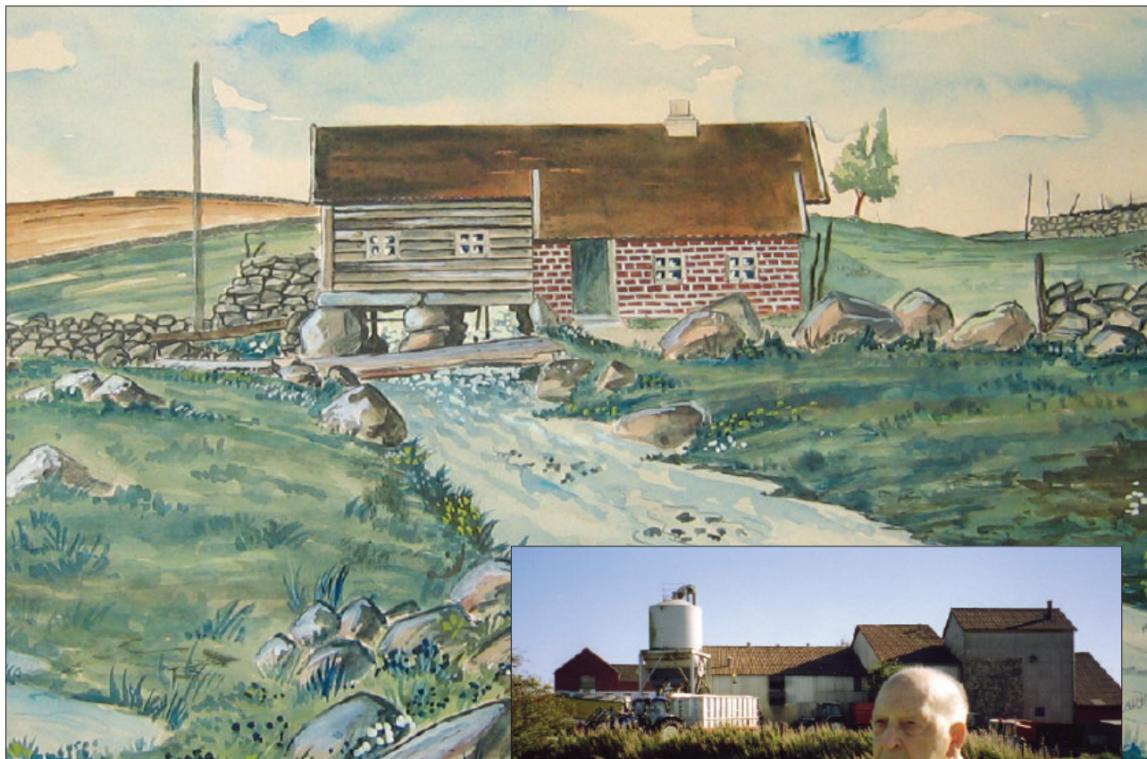
På Lode låg det på 1800-talet fleire bekkakvernar. Dei vart kjøpte opp, og ny, større mølle vart bygd. Den nye mølla gjekk opp i flammar i 1946. Akvarell av Harald Øglænd 1943.