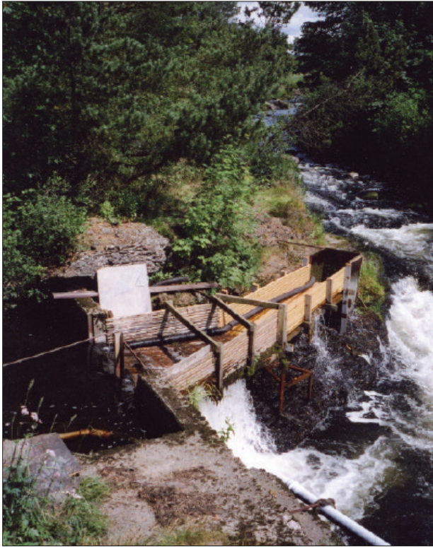
Framleis vert det fanga ål i vassdraget. Her er eit ålekjer ved Fotlandsfossen. Det er spiler i botnen og i enden av kjeret, slik rann vatnet gjennom medan ålen vart fanga opp på vandring ut.

i Tyskland. Ål vert rekna for å vera mat for gourmêtane. Kvar sin smak. Ikkje forstår eg det!