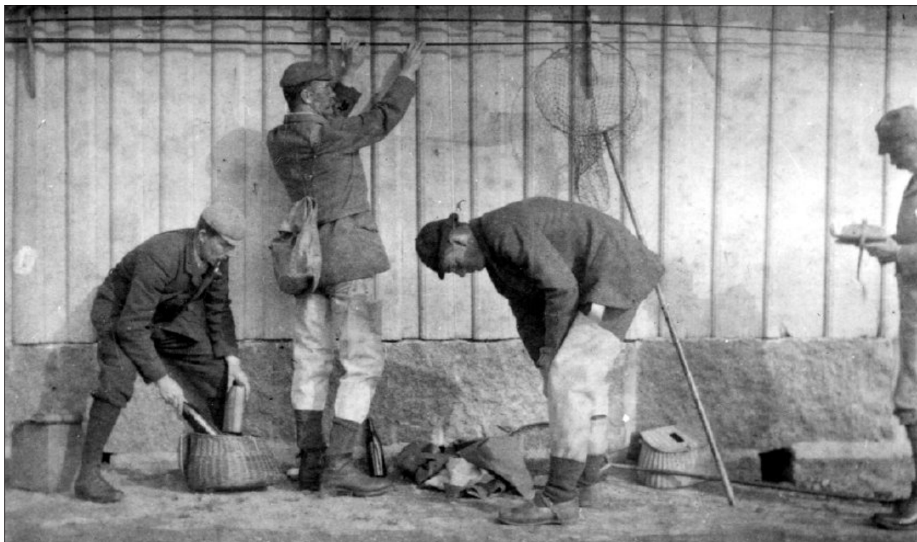
Frå 1880-åra til 1914 fiska ei gruppe engelskmenn kvar sommar i den nedre delen av ånå. Oline og Torger på Nærland var vertskap for desse fiskarane frå byen Chester i 1890-åra.

før frå siste halvta av 1800-talet. Og det fisket som me ser i dag, er på mange vis eit dekadent utslag av overflods- og forbrukarsamfunnet, i stor grad prega av snobbete motemerkevarer både når det gjeld fiskeutstyr og klede.