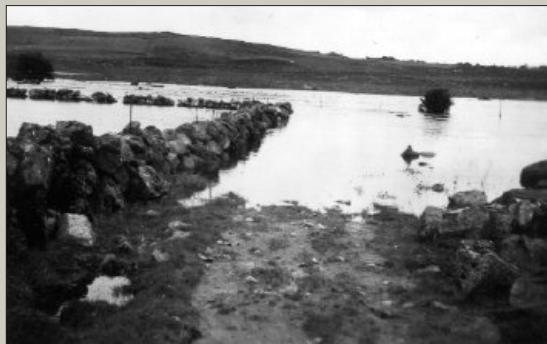
Flaumen i Håelva i september 1957 vart kalla "Katastrofe-flaumen". Elva gjekk langt utover sine naturlege bredder i stort sett heile si lengd. Biletet er frå Fotland.