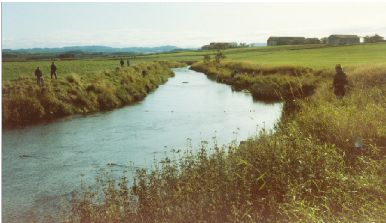
Fangsmetodane i elva har vore mange og varierte. Her er to lag ute på reking med garn etter stamfiske. Det gjekk ein person på kvar side og heldt i garnet. Korkane ligg på tvers over elva.