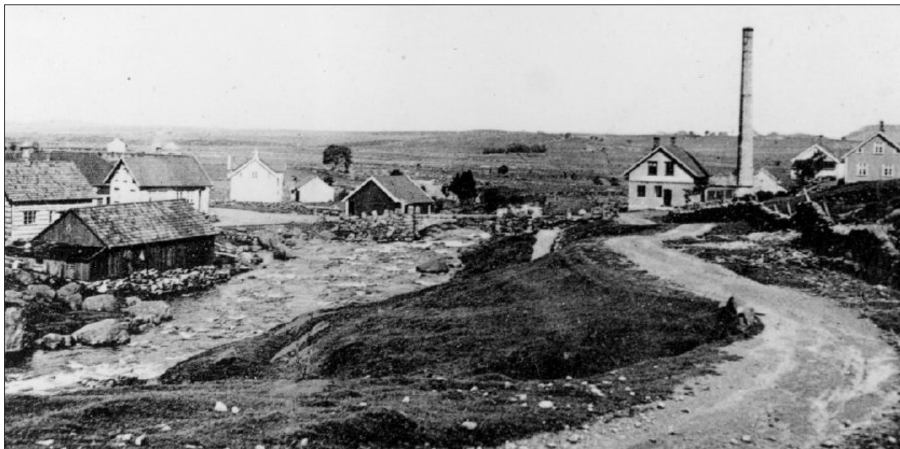
Undheim meieri sto ferdig 18. februar 1898, og tok første dagen imot 401 kg mjølk frå 21 leverandørar. Meieriet vart bygt ved åa for å nytta vatnet til kjøling av melk og drivkraft til maskinane. Heilt til høgre i biletet ser vi ishuset.