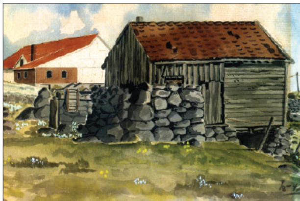
Det var gardskvernar – òg kalla bekkakvernar – ved den minste til den største bekken som renn ut i Håelva. Fleire stader låg kvernane på rad og rekke. Det var ikkje så mange kvernar langsmed sjølve hovudvassdraget. Rett ovanom utlaupet til Tverråa på Haugland låg ei stor mølle, her etter akvarell av Harald Øglend i 1942.

Då bygdemølla Lode Mølle tok form ved Lode-