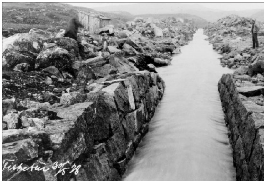
Største regulerede vassmagasinet for kraftstasjonen på Fotland, var Storamose. Her ser vi utløpet til vatnet.