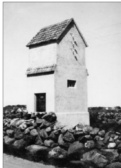
Det måtte setjast opp transformator kioskar. Det vart litt ulike byggjestilar, ei kort tid vart dei bygde i tre, men seinare i betong.

over produksjonen, vart han mindre og mindre av det totale forbruket. Spørsmålet om det var forsvarleg å driva verket vidare, dukka opp. Styret gjekk i møte 29. juni 1972 inn for at verket skulle leggjast ned, men det var kommunestyret som hadde siste ordet i den saka. Før saka vart fremja for kommunestyret, havarete turbinen 21. juli 1972. I november vart det fatta formelt vedtak i kommunestyret om nedlegging av eit verk som hadde vore i drift i 57 år. Turbinane på Fotland stilna, og laks, aure, ål og alt anna levande i Hå-elva får nå vatnet aleine.