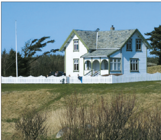
Jonsahuset på Nærland.

Men slik eg minnest det, hadde alle snelle, som då sjølvsagt vart flytta over på den nye stonga. Og dei fleste fiska med fluge, meir sjeldan med sluk. Makk vart berre nytta av born som fiska etter aure og ål.