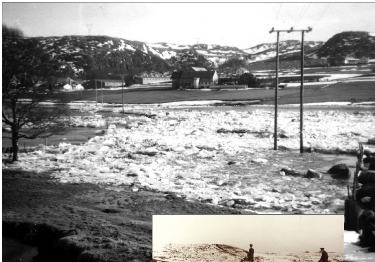
Håelva kan skapa seg på mange vis. Her fløymer vatn og is langt utover på grunn av isgang i elva. Vi ser mot bruka på Litla Undheim.