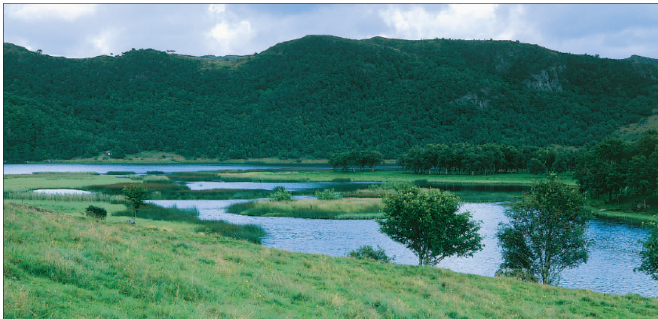
Det er fint å slå seg ned ved utløpet til Taksdalsvatnet. Utløpet var nytt då vatnet vart senka med ein og ein halv meter i 1882. Før den tid hadde vatnet utløp sør om Taksdalsgarden og rann vestetter mot Årestad og Lende.

elvefaret mykje djupare med enkle inngrep, og det ville ikkje vera urimeleg langt å grava for å skaffa elva eit nytt far, og så var det godt fall vestetter. Altså: eit nytt elvefar måtte leggjast nordføre Taksdalsgarden. Det ville kosta meir pengar enn oppsitjarane kunne leggja på bordet.