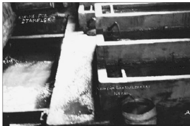
Kummar for stamfisk i lakseklekkeriet på Nesheim.

som nytta kvar anledning til å fiska i elva.