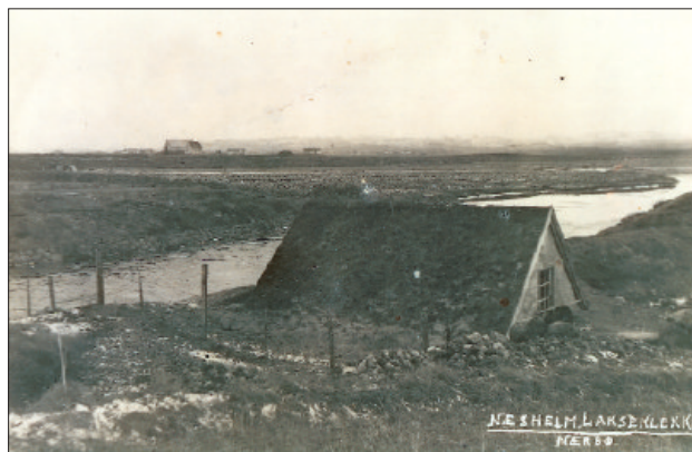
Lakseklekkeriet på Nesheim, me ser nordaustover mot Søyland.