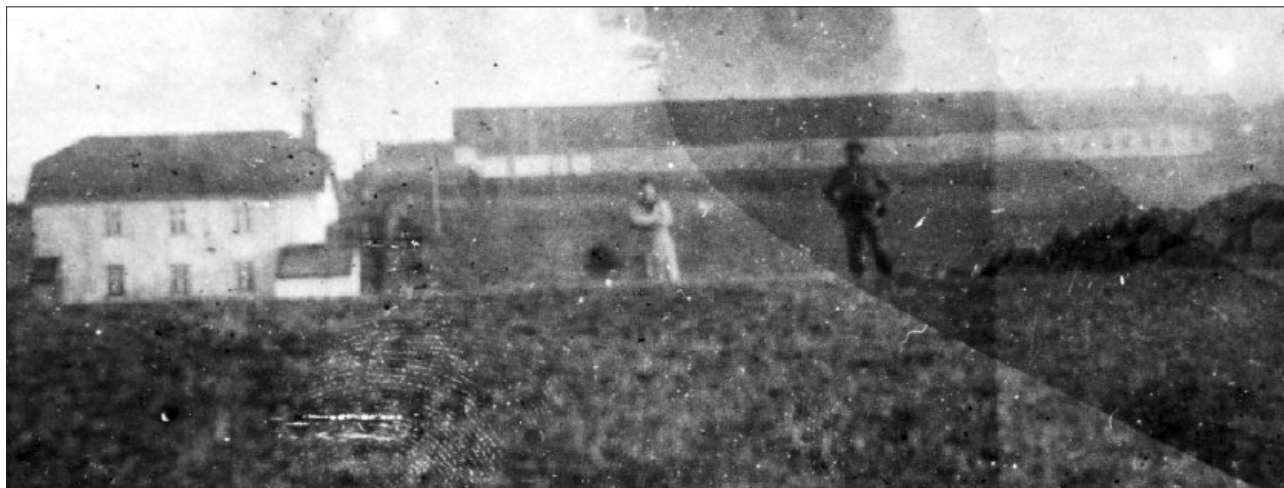
Dette gamle biletet syner møllebruket på Nesheim bygt før 1860. Også denne mølla fekk vatn frå Lodebekken. Ved mølla låg det eit lite kraftverk som kom i drift i 1906. Møllebruk og kraftverk brann ned 2. februar 1944.

optimistisk nært elva. Flaumen kom og kverna fôr med alt som var, til sjøs, må vita. Då kom det etter ei stund melding frå Vik at dei mellom andre strandrekster hadde funne kornausa til oldefar Oma. Det var ganske enkelt, for han hadde skore bokstavane sine inn i ausa.