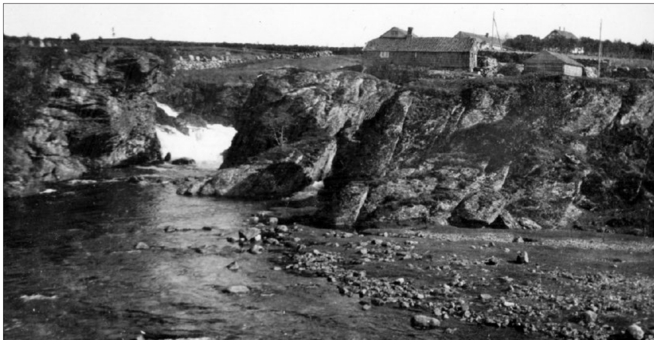
På Fotland – som vi ser her – var det mølle og stampe og det var eiga smie knytta til anlegget. Foto: Peder Netland. * Fotosamlinga i Time Folkebibliotek.