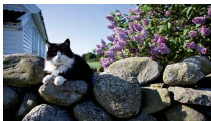
Det har kome dyr på garden på Vistnestunet, og katta kosa seg i sola

Over 100 besøkande tok turen til Vistnestunet søndag 7. juni då Jærmuseet og Randaberg kommune inviterte til Open Gard.