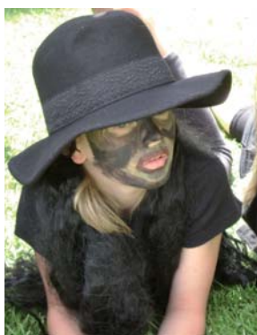
På Limagarden var det dramatisering av "Dei 3 Bukkene Bruse". Her er eit av dei mange trolle som budde, under brua.

Det vart ei flott veke i strålende solskin, med aktivitetar som å laga kvernkall, presse blommar og samla innsekt. Alle barna laga til ei forestilling om "Dei 3 Bukkene Bruse" som dei framførte for foreldra siste dag. Ei flott veke med stor pågang, må me kanskje ha to veker neste år?