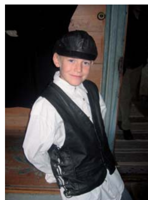
Ungane på Ferieklubben liker å kle seg ut med klede frå gamle dagar.

På Grødalalandstunet i Hå er det tilbod frå 23. juni til 13. august for dei som er mellom 8 og 12 år. Ferieklubben vert arrangert av Jærmuseet og Hå kommune, og mange ungar ynskjer å vera med. Fyrste veka er unnagjort. I solsteiken fekk ungane laga is på gamle måten, dei kosa seg med å kle seg ut som barn i gamle dagar og hadde mange spanande aktivitetar. Ferieklubben vil gå fem veker denne sommaren, og andre besøkande til Grødalaland får òg vera med på aktivitetane og smaka på gammaldags mat.