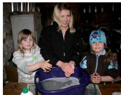
Å tova sauer av ull var populært på Limagarden.

Sundag 10.mai arrangerte Jærmuseet og Ålgård hagelag Hage- og aktivitetsdag. Ålgård Hagelag brukar Limagarden kvart år til å selga stauder og blomar til grøne fingrar, nytt i år var at Jærmuseet var med. Dette viste seg å vera eit populært tilbod, ettersom meir enn 150 store og små fann vegen til gards. Dei kosa seg blant anna med urtesuppe, toving, smiing og uteleik. I tillegg fekk ungane vera med å lage tvårer, og det var særst spanande å sjå på dreining av eggeglass. Hagelaget selte ut blomane på kort tid, og det ga meirsmak til meir samarbeid neste år.