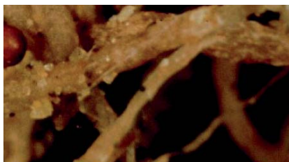
Hoer og cyster av kvit potetål på potetrøter.

messig. Potetål kan føra til bandlegging av gardsdrifta i opptil 40 år. Verdien av garden går ned og drifta må leggest om.