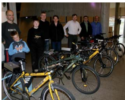
Deltakarane på "bygg din eigen sykkel" var nøgde med resultatet.

15 deltakarar var med på kurset. Dei fleste bygde om sine eigne sykklar til el-syklar, dette tok 6 kveldar. Så ser du nokon som susar forbi deg der du kavar i oppoverbakken – så er det nok ein av kursdeltakarane på elsyklar frå Vitenfabrikken!